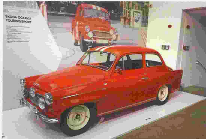
Škoda 1200 TS Touring Sport

Der erste Škoda Octavia erschien vor genau 60 Jahren und läutete die allgemeine Mobilität in der Tschechoslowakei ein. Spät aber immerhin. Die Industrie wurde im Zeiten Weltkrieg kaum beschädigt, konnte produzieren und so verspürte das neue Regime keinen Bedarf zu modernisieren und zu vergrößern. Dazu fehlten auch die nötigen Devisen.