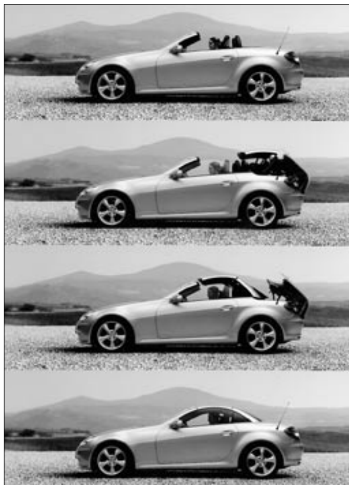
Proměna otevřeného prostoru posádky v uzavřený a naopak se stává stále snadnější a rychlejší. Systém elektrohydraulického ovládání sklopné střechy nachází uplatnění u více výrobců. Na snímcích jsou zachyceny jednotlivé fáze uzavírání střechy u nejnovějšího typu Mercedesu SLK.