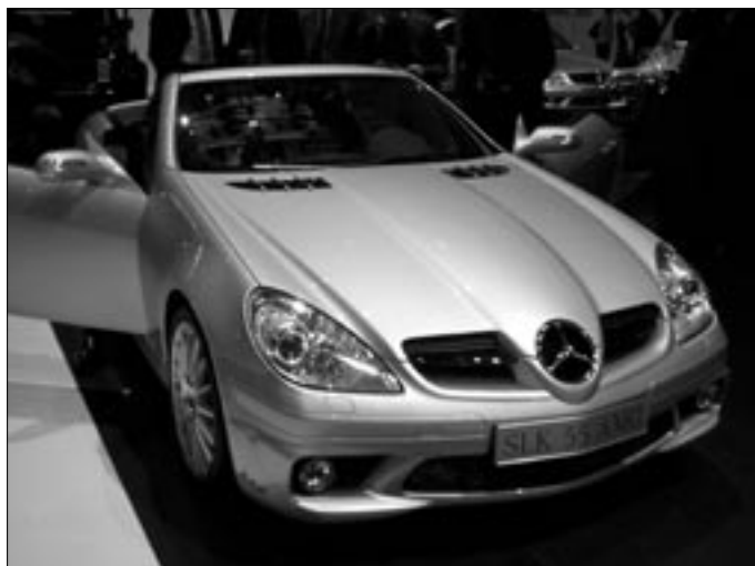
Mercedes-Benz SLK druhé generace měl svoji premiéru načasovanou do Ženevy. Nabídka motorů je jako vždy široká, čtyřválcové 2l s kompresorem, šestiválcové 3,5l, osmiválcové 5,5 l a navíc i v úpravě AMG pro ty nejnáročnější řidiče.