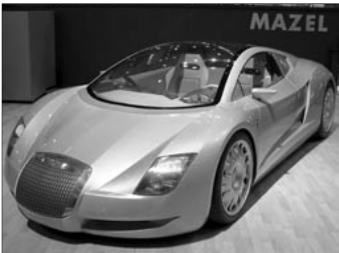
Ze širokého spektra nejrůznějších kupé poněkud vybočoval prototyp se znakem Hispano-Suizy na přídi karoserie s celoprosklenou střechou, která pokračovala až nad motor před zadní nápravou. Horní části hlav motoru si tak bylo možno prohlížet „přes sklo“ podobně jako kdysi u Tatraplanu.

Co do velikosti výstavní plochy jedna z největších patřila koncernu GM, který zahrnuje značky Chevrolet, Daewoo, Opel, Saab, Vauxhall i výrobce obrovitých offroadů Hummer. K novinkám patřila především další již 6. generace dvousedadlové Corvette C 6 (Chevrolet )