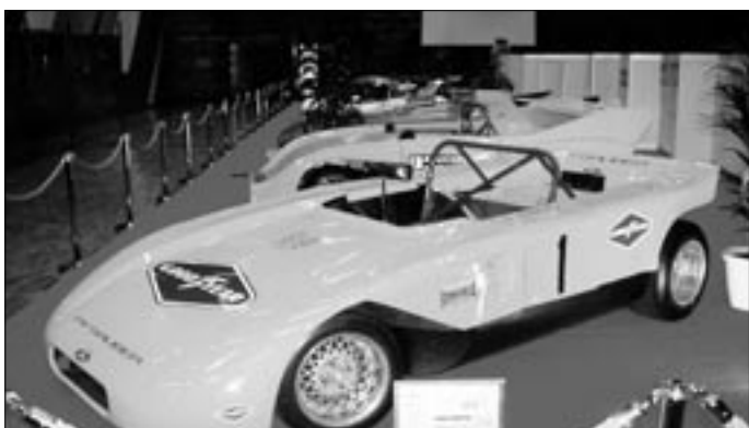
Jeden z prvních vyrobených sportovních vozů Sauber, ještě s motorem Ford.