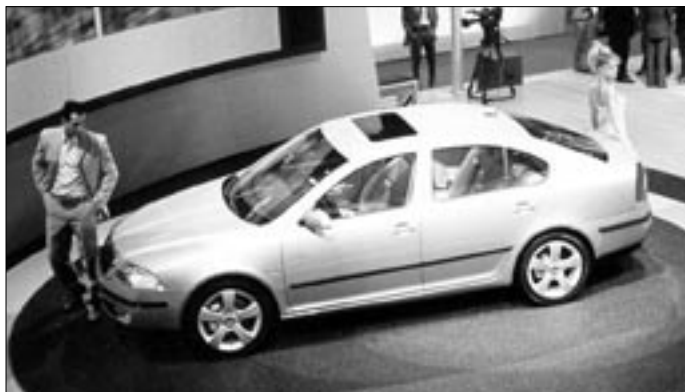
Škoda Octavia opět trochu větší a lepší, zůstává však stále jen konvenčním typem