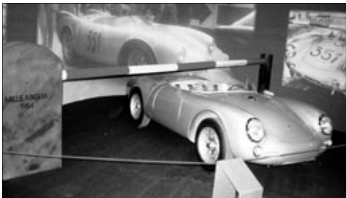
Spider Porsche, umístěný hned pod železniční závorou připomínal tuto událost se šťastným koncem před padesáti lety.