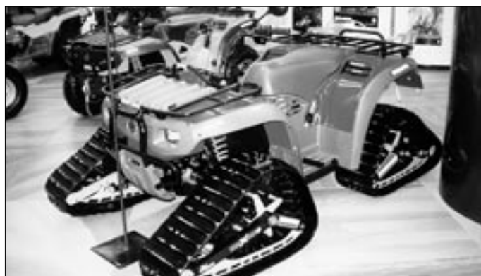
„Čtyřpásovka je zvláštní verzi čtyřkolky do typických švýcarských podmínek, zvláště sněhových.“