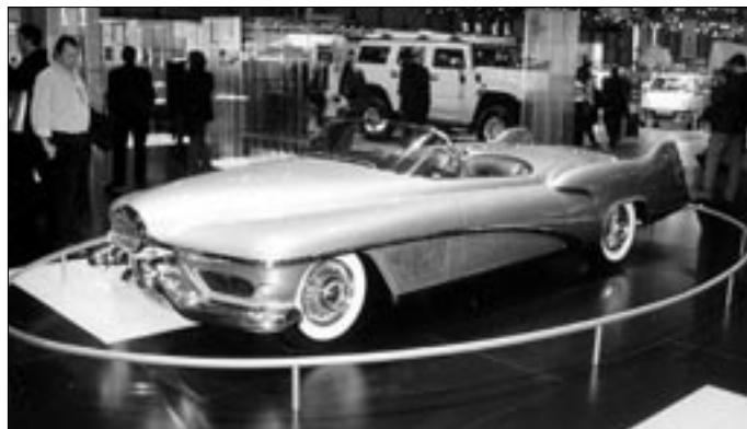
Koncept – prototyp Buick Le Sabre z roku 1950, který zůstal v jediném exempláři poutal pozornost na výstavní ploše GM.