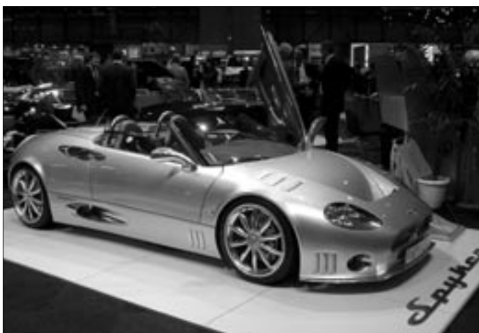
Salon se neobejde ani bez jiné pastvy pro oči...krásné, perfektně oblečené (v některých případech jen částečně) dívky obletují neméně pěknou studii od Hondy nebo prodejného Spykera. Věřte, že kolikrát těžké je na chvilku „odehnat“, aby bylo možno pořídít snímek jen samotného automobilu.