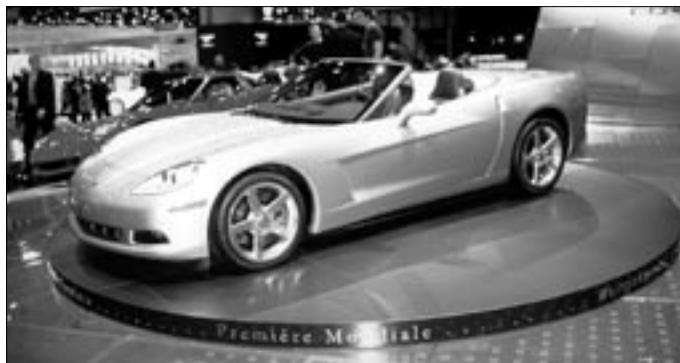
Chevrolet Corvette Convertible již 6. generace se šestilítrovým osmiválcem o výkonu 400 k.