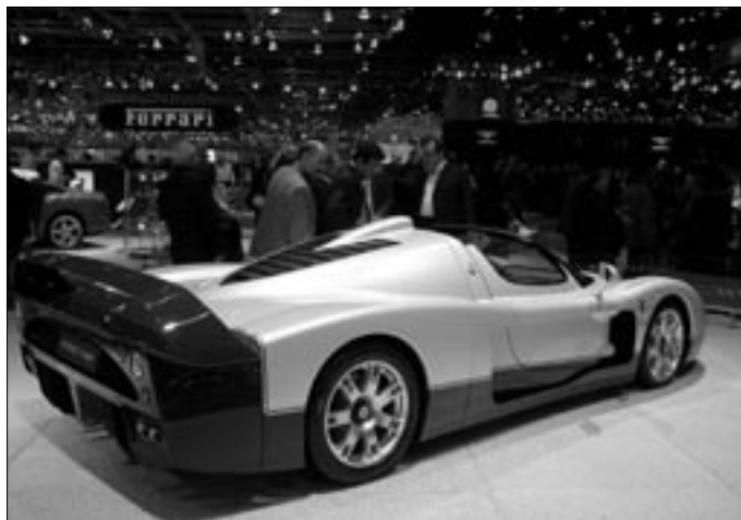
Modrobílý spider Maseratti má navázat na pominulou slávu značky.