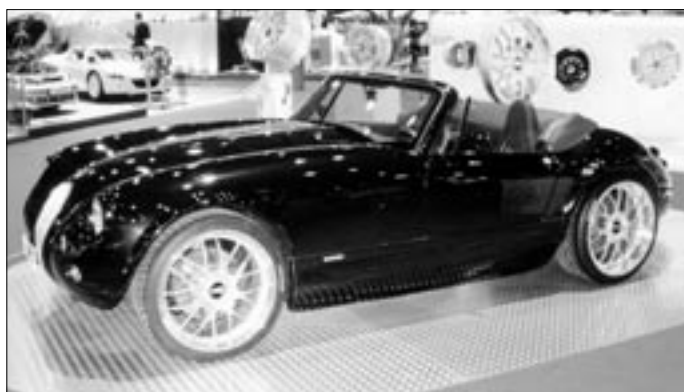
Wiesmann MF3 svým klasicky vystříženým tvarem i rozměry více připomíná anglickou produkci. Solidní provedení je však typicky německé.