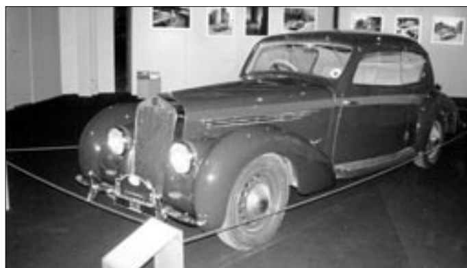
Muzejním exponátem je tento Talbot s typickou karoserií kupé a proslavený úspěchem v rallye Monte Carlo.