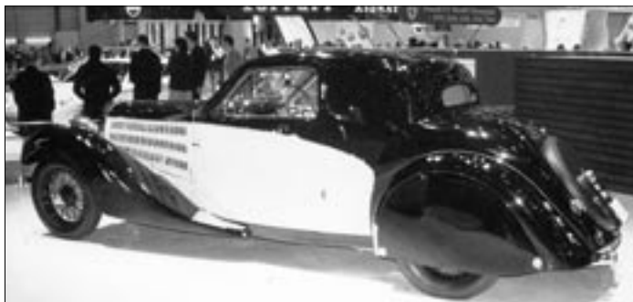
Bugatti nyní součást koncernu VW vystavuje jako obvykle dva vozy. Tradičně současný pohádkový sporták Veyron 16-4 z 1001 a jedné noci (má výkon 1001 k), který je už po několikáté přepracován, výkon trochu zmenšen, cena trochu zvýšena, počet výrobků trochu snížen a termín prodeje zase posunut... V kontrastu s tímto kupé nejmladším pak pozornost přitahovalo naopak jedno z kupé nejstarších – skvostný typ 57 z roku 1934.

znovu přesvědčovat, že se stále daří mít je ještě o něco lepší. Je také dobrým zvykem, vystavovat i předchůdce současných typů a při troše představitosti i porovnávání lze odhadovat, který s exponátů se v budoucnu může stát „klasikem“ a předmětem zájmu sběratelů.