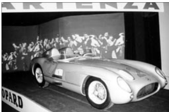
Vítězný Mercedes SLR z ročníku 1955 řízený S. Mossem byl také vystaven a účastníci tiskové konference si mohli odnést jeho věrný model v měřítku 1:18 z limitované série.

solidně vyhlížejícím sedanem a elegancí štíhlého nízkého kupé (čtyřdveřové kupé) s menším prostorem u zadních sedadel.