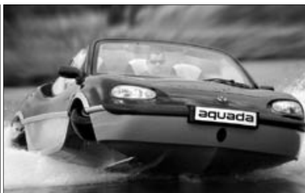
Anglický obojživelník Gibbs. Na vodě se pohybuje klasicky jako rychlý člun 50kmh a je vybaven šestiválcem o 2.5 litru, který disponuje 175 koňmi. Ředitel firmy p. Hemal Vasavada označil svůj produkt jako „Perfection in it self“ a plaváčka nám chtěl hned prodat. V Evropské Unii se prodává za pouhých 185 000 eur, tedy kolem 5,5 milionu korun (bez DPH!). Za to si můžete sáhnout z auta přímo do vody...