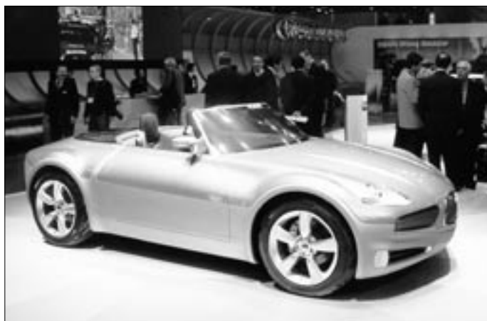
Poměrně krátký roadster 4x4 Subaru, značky, která je ve švýcarsku velmi oblíbená, je dosud ve stadiu prototypu.