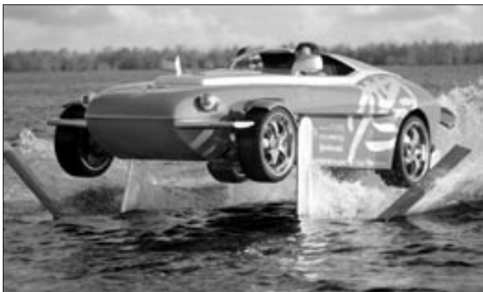
„Plaváček“ čili obojživelník Rinspeed se „Z“ pohonem lodního šroubu a s nosnými plochami umožňující rychlou jízdu – plavbu i na jezeře budil velkou pozornost zvláště když se vznášel i v hale výstaviště ve zvednuté poloze. Krásný důkaz realizované lidské fantazie.