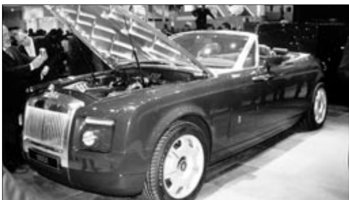
Rolls-Royce lze řadit k největším kabrioletům světa, na robustnosti mu neubírá ani hliníková kapota, kterou měvaly luxusní vozy již před osmdesáti lety.