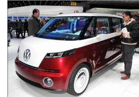
VW v retro stylu není ještě na trhu, a tak se spekuluje o elektrickém pohonu. Jedno je jisté: levný nebude

Fabia Monte Carlo v provedení bicolor, červeno-černá, jen potvrdila, že Škodovka je na správné cestě a je zaslouženě úspěšná. Hostesky byly tento rok velmi kompetentní a slovanskou pohostinnost završilo i vynikající plzeňské. S povděkem jsme registrovali absenci kopie vozu Voiturette firmy Laurin & Klement, i když by se tentokrát mezi další repliky v rámci autosalonu docela hodila. Zrovna tak jako Porsche doplňuje svou krátkou firemní historii rakouským vozem firmy Lohner – neříká se tomu „...cizím peřím“?