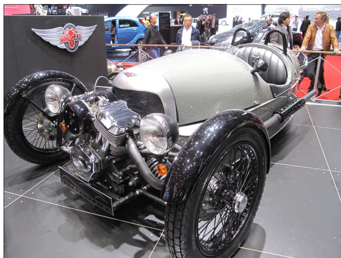
Morgan měl premiéru tříkolky podle vzoru modelu Aero Super Sport z roku 1930. Předpokládaná cena je kolem 850 tisíc korun

U Fiata vystavovali dvě různorodá, ale obě silně atraktivní červená auta – mrštná pětistovka ve stylu retro kontrastovala s o 100 let starším obřím závodním autem. Již jeho přezdívka nahání přinejmenším respekt: přes 5 metrů dlouhý a skoro 2 metry široký Mefistofeles má motor s obsahem 21 litrů (přesně 21 706 ccm). Každý ze šesti válců uspořádaných v řadě má velikost pořádného nočníku – 180 x 160 mm. Sání pohonné směsi ze čtyř karburátorů FIAT a výfuk splodin zajišťují 4 ventily pro válec. Tento obří motor byl do auta namontován za účelem dosažení nových rychlostních