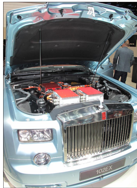
Rolls-Royce Phantom 102 EX se dvěma elektromotory, silnější než původní 12V, už naši atmosféru nevytrhne a zůstane asi unikátem jako jeho Emily z křišťálu

Kořením ohromné nabídky hybridních, elektrických a ostatních technicky vyzrálých aut, kterých bylo k vidění a obdivu