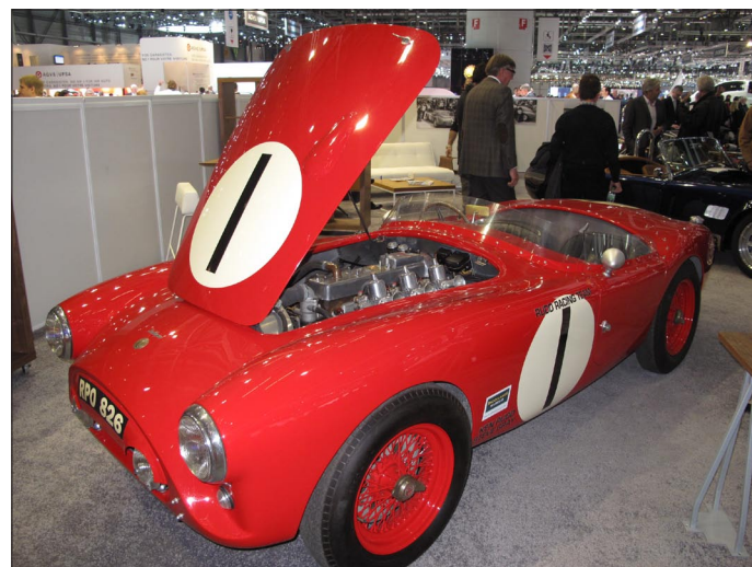
AC, jak ho neznáme – původní a zřejmě jediný zachovalý závodní vůz toho typu s motorem od Campbella, se kterým vítězil Ken Rudd