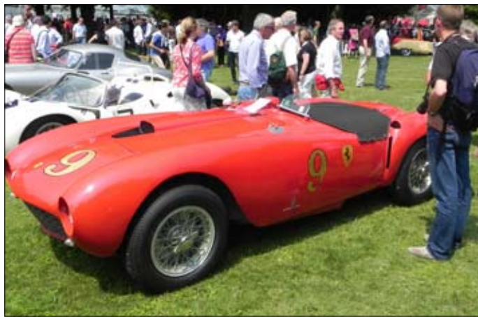
Ferrari 375 MM, netknutý nálezořový stav, 1953, nyní v rakouských rukou