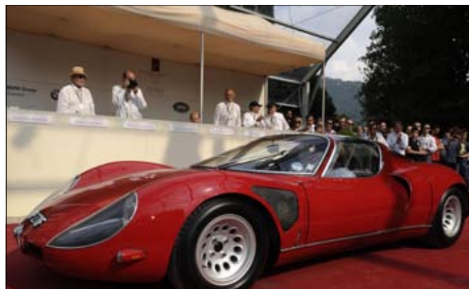
Alfa Romeo 33 Stradale, 1968 Scaglione Best of Show, 1. cena Coppa d'Oro Villa d'Este 2011