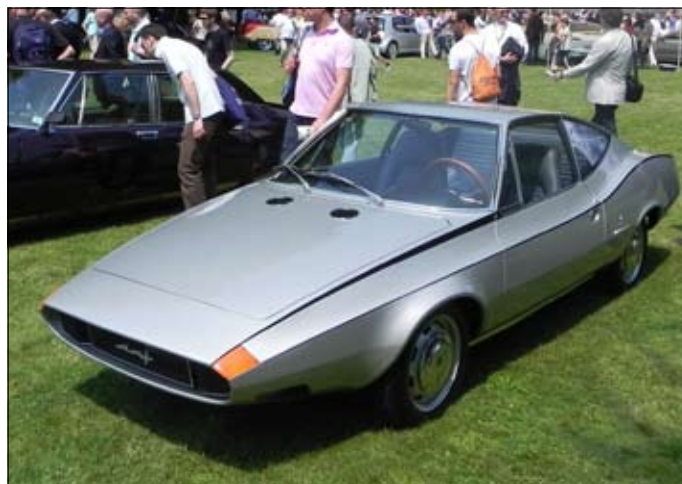
DAF 55 Siluro, karoserie Michelotti, 1968