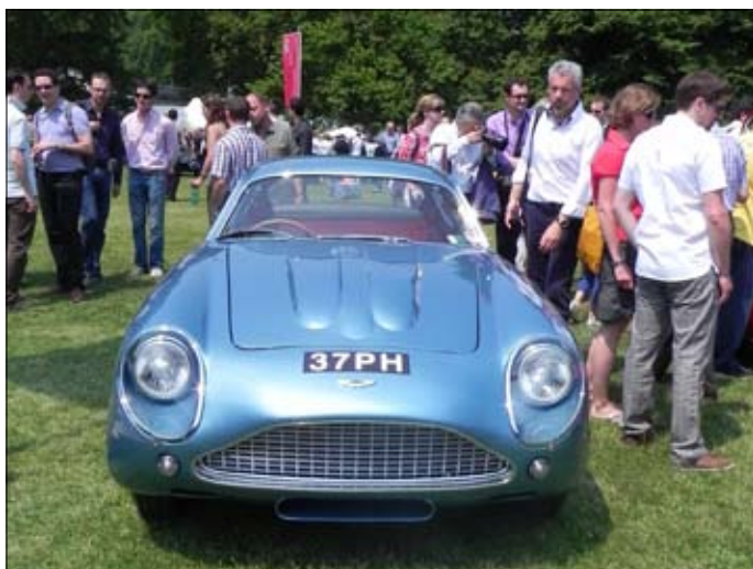
Aston Martin, DB4 GT (1963)s karoserií Zagato, Berlinetta