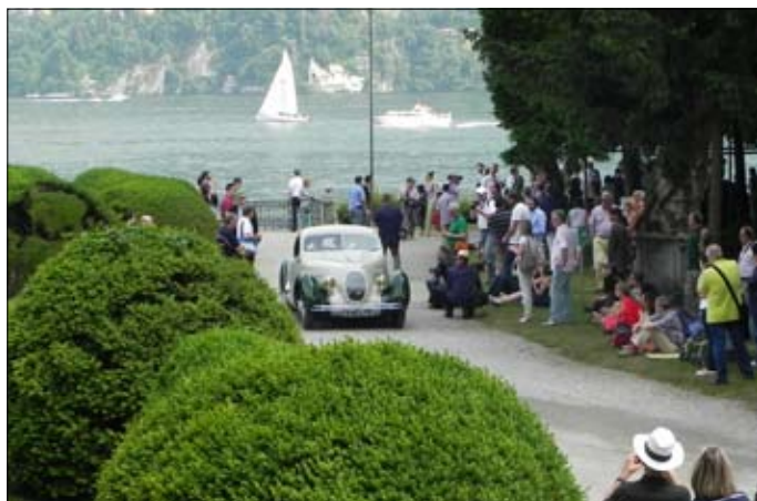
Defilé účastníků vedlo parkem kolem hotelu