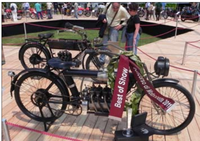
Vítěz Coppa d'Oro motocyklů, Pierce Four, právě stoletý