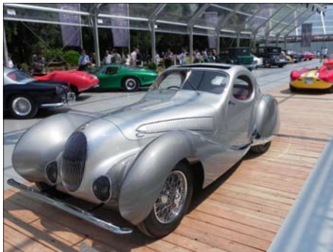
Aukční Talbot-Lago TI50C-SS zvaný „Goutte d'Eau“ z roku 1938 stál přes 3 miliony eur