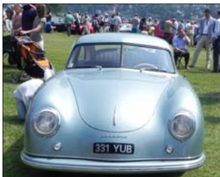
Jeden z prvních Porsche – karoserie Reutter, 1951, vylepšený motor VW