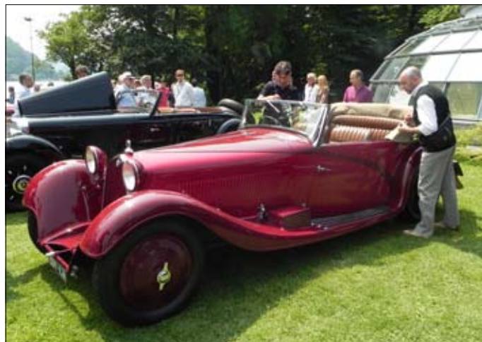
Alfa Romeo, 8C 2300, 1932 Cabriolet Pinin Farina

V Řecku mnoho veteránů není (nejvíce je embéček a brouků) a klubů jen pomálu, ale i zde potvrzují výjimky pravidlo. Vazeosův Delage je jedno z prvních aut této kategorie, které vykazuje aerodynamické prvky.