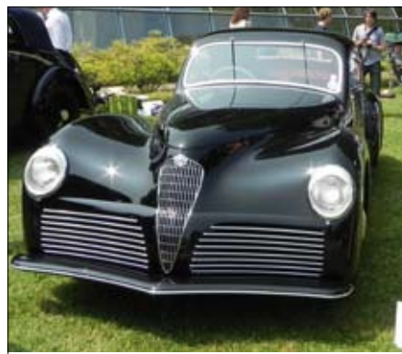
Alfa Romeo C6 2500 SS, Bertone, 1942, oblíbené auto Mussoliniho – vítěz hlasování veřejnosti

vyráběla nejen zákaznické karoserie pro prominenty a movité automobilisty, ale i hasičské pumpy s tatrováckým motorem.