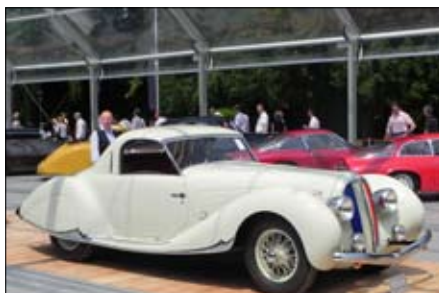
Delahaye Coupé v národních barvách...

Pastvou pro oči a pohádkou pro uši je historie vystaveného závodního Ferrari 375 MM roku výroby 1953. Jeho původní patina a výjimečně zachovalý stav vyzářoval tak zvláštní šarm, že se v tomto případě porota před přírodou a pravidly soutěže sklonila. Auto totiž po posledním závodě v roce 1974 zcela zmizelo, aby až po téměř