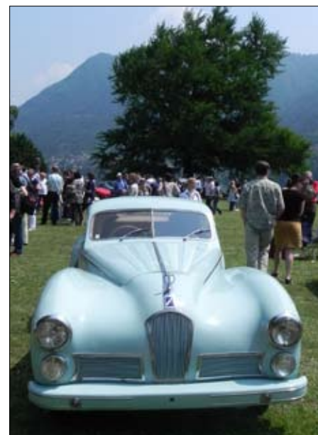
Zvláště starší auta a jejich majitelé vyhledávali letos stín před Grandhotelem Villa d'Este