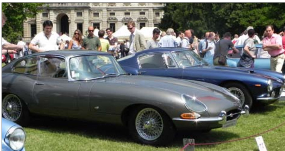
E-Type, první vystavený prototyp v Ženevě 1961, majitel Ch. Jenny, Zürich

Tradiční součástí Concorso je i prodejní výstava ve formě aukce. Aukční síň RM nabízela vybrané specialitky jako Delahaye, Bugatti, Hispano-Suiza, Ferrari, Bentley a Rolls-Royce v nejrůznějších variacích, Talbo Lago 1938 jako z pohádky a jedinečnou Lancia Stratos HF Zero, za kterou se očekávaly dva miliony dolarů, a přešel dalších kletotů. Nebyla nouze ani