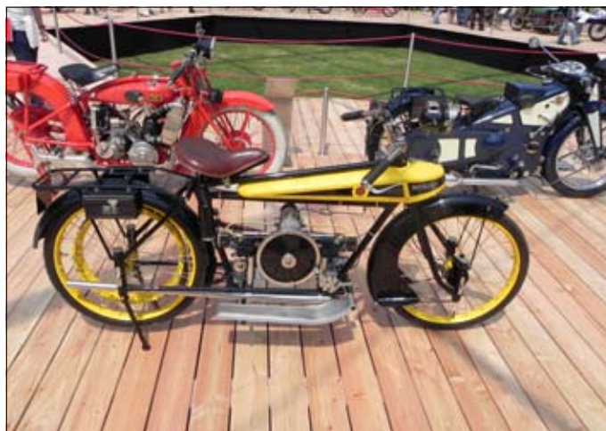
Wooler, motocykl po každé stránce unikátní