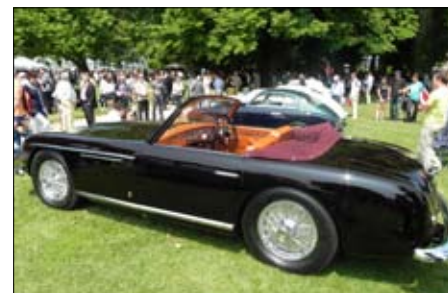
Talbo Lago T 26, 1951 Farina – původní pařížská SPZ, majitel z USA