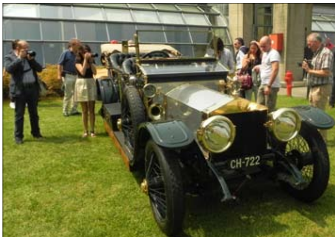
Rolls z Austrálie s nepřetržitou a doloženou historií od roku 1911, Sir Gibson, matching numbers 1606, stále v provozu, vítěz několika Concours a Rallyes