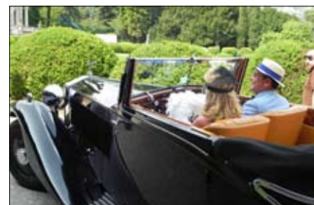
Nejstarší je auto a pak hned spolujezdkyně, zatímco řidič je poválečný model...