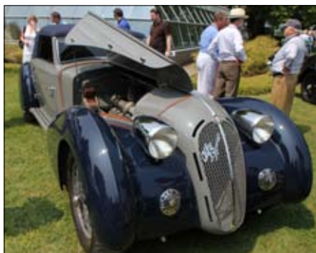
Alfa Romeo Cabriolet, 8C 2300