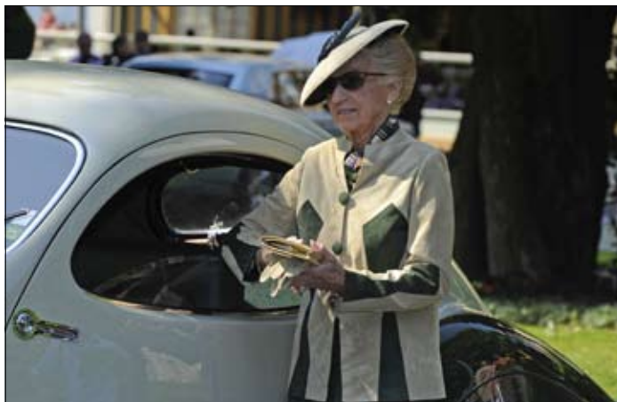
Talbo Lago 1938 z USA, karoserie Fioni & Falaschi, i s vytříbenou majitelkou Grande Dame

celkové druhé místo klasická alfa z válečných let, oblíbená značka Mussoliniho, typ 6C 2500 SS, přičemž SS znamená Super Sport. V jednotlivých kategoriích se hodnotil sportovní výkon, elegance, originalita, pokrokové řešení atd.