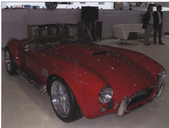
Tradiční AC Cobra, nová a spolehlivější