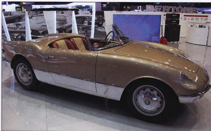
Tato Alfa Giulietta Sprint Spider od Bertone byla vyrobena 1955 pouze jednou