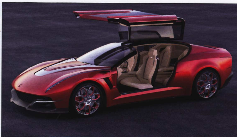
Brivido je nejnovější produkt Ital Designu (Giugiaro)

o nečekaném úspěchu renegate tree-wheeleru, jak se již rýsoval během prezentace v Zürichu. Devět stovek dosud nevyřízených objednávek rychlé trojkolky při uhrazených zálohách zcela zahltilo mateřskou firmu v lázeňském městečku Malvern.