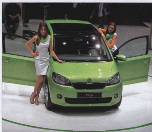
Na stánku Škoda-Auto. Děvčata z Moravy ochotně pózovala kolem novinky Citygo a americký novinář se zajímal nejen o techniku, ale svojí výškou 224 cm přiváděl personál do rozpaků při pokusu usadit se v autě