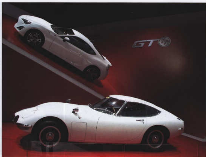
Toyota 2000 GT