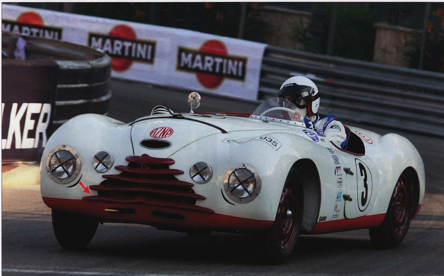
Škoda Sport na trati Le Mans