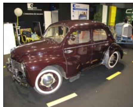
Renault 4CV se dovážel i k nám