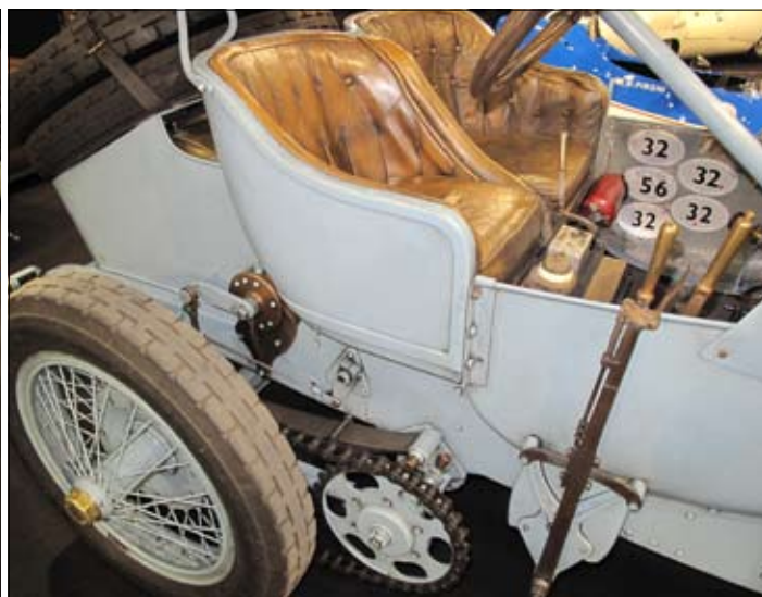
Závodní Panhard Levassor 1908 s dvojitým řetězovým náhonem