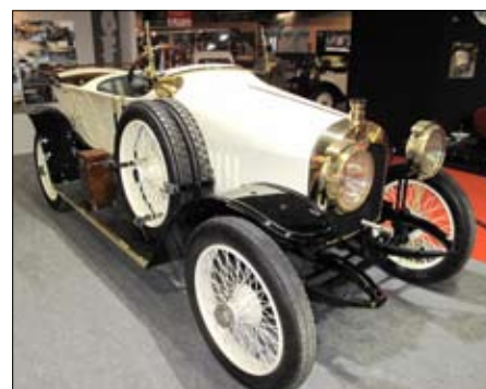
Bílá Audi z roku 1913 bylo za účelem zvýšení jeho rychlosti na karoserii odlehčeno leteckým plátnem

Lang a Riess vyhráli na Mercedesu 300 SL v roce 1952 Le Mans a o 60 let později v lesku této dávné slávy představil Mercedes