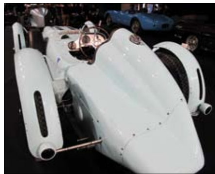
Talbo Lago Monoplace Décalée, 1939, nádherný vůz s kompletní ale ne zvláště úspěšnou závodní minulostí měl konkurovat německým šípům

Na dotaz mi pan Bergsma vysvětlil, že dvoulitrový motor se dvěma vačkovými hřídeli postavil pro Gérina zkušený konstruktér Janvier Sabin. Zapalování obstarávala dvojitá magnetka a svíčky měl z obou stran motoru. Celý motor s příslušenstvím byl usazen před zadní osou a dal se prý demontovat jedním (francouzským) klíčem za 15 minut, jako to později sériově realizoval Porsche u brouka. Předimenzovaný chladič s velkou čtyřlopatkovou vrtulí