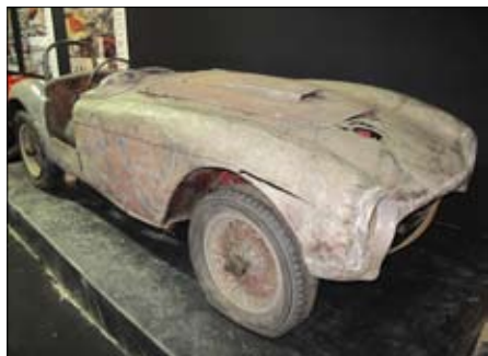
Ferrari 250 s rodokmenem bude na renovaci ještě chvíli čekat