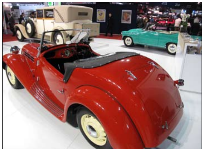
Pěkně instalovaná výstava produkce Škoda-Auto od roku 1925 spolu s motocyklem firmy L & K