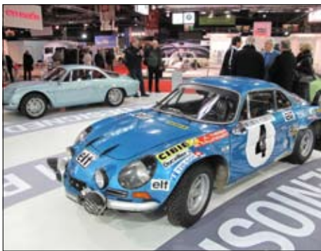
Před 110 lety završel u Renaultů poprvé motor vlastní výroby a to je důvod vystavit na Rétromobile potomky s typovým číslem 110 – Alpine Renault A 110

firmy Cotal, jejíž ovládání joystickem se nápadně podobá tomu, s čím si dnes hrají děti na konzolách, a Rochet Schneider 26 SIX ročník 1930 z lyonské nobl kovářny stály opravdu za trochu delší zastavení a poklábosení o podrobnostech renovace. A pak tu byla k vidění po dlouhé době jedna monica. Malosériový vůz s americkým motorem se dochoval jen v několika prototypích. Historie tohoto posledního francouzského luxusního vozu, který se měl stát nástupcem facelů, je plná nejasností. Monica měla být tím „nej-nej“ a byla myšlena pro nejvyšší vrstvu solventních kupců. Že tyto vozy neznáte? Nevadí, o nich vyjde první kniha.