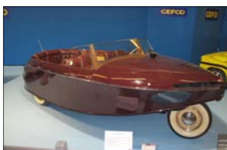
Hydromobil – tříkolový, celodřevěný člun, řetězem poháněn Fordem V8, je unikát z roku 1942