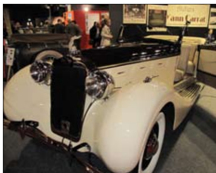
Delage DB 120 od Chaprona, r. 1937, ztrávil pod plachtou 40 let, s klíčkem pod volantem a byl restaurován za 3120 hodin