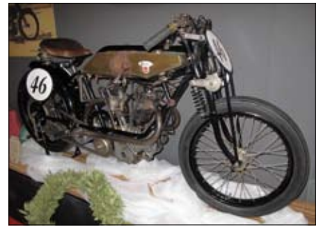
Úspěšný Wanderer 1927, 700ccm s osmi ventily bude dodán i s původním věncem vítěze