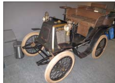
Renault se španělskou karoserií v původním stavu z roku 1900

vydraženy pod 300 000 euro. Všele zájmu ale bylo Ferrari Spyder LWB režiséra Rogera Vadima. Zvláště pro Francouze vyznačuje toto Vadimovo Ferrari, označované také jako California, magické kouzlo. Vždyť se v něm proháněl po St. Tropez a po Paříži s Brigitte Bardotovou a Annette Stroybergovou. Jeho prodej za 4,5 milionu eur (přes 100 milionů korun) předčil očekávání. Ve hře bylo i několik vozů značky Facel, z nichž typ Excellence přinesl prodejci skoro 200 000, a Bizzarini za 350 000 také příliš nepřekvapilo. Naopak o Maserati příliš zájem nebyl.