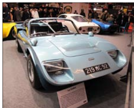
Do perfektní podoby individuálně postavené sportáky, vycházející v základu z běžných automobilů. Zde La Collet...

zajišťoval dobré chlazení. Sklon volantu se dal nastavit z řidičova sedadla a palubka byla poseta kontrolními instrumenty. Jeden speciální budík měl dvojitý indikátor tlaku oleje v třecích tlumičích předních kol. Pérování zajišťovaly trojitě vinuté pružiny