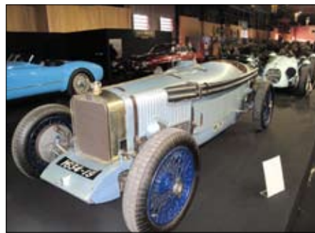
Dalage V12, ale pouze 2L! pět rychlostí z roku 1924

zajišťoval dobré chlazení. Sklon volantu se dal nastavit z řidičova sedadla a palubka byla poseta kontrolními instrumenty. Jeden speciální budík měl dvojitý indikátor tlaku oleje v třecích tlumičích předních kol. Pérování zajišťovaly trojitě vinuté pružiny