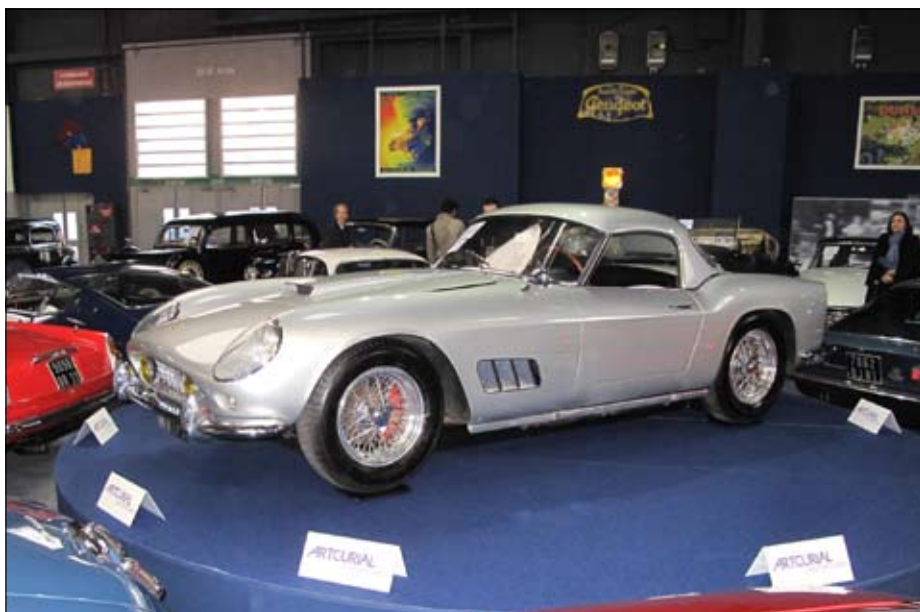
S tímto krasavcem, Spyder California LBW vozil Roger Vadim Brigitte Bardotovou