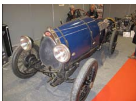
Avantgardní a úsporný Panhard Dyna na klubovém stánku vedle Bugatti Brescia