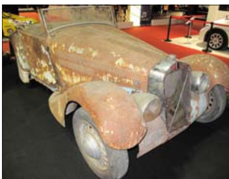
Karoserie raritní značky George Irat je dnes skoro průhledná