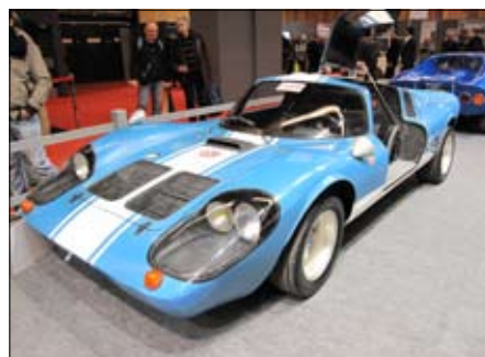
...a další ukázkou je La Romer