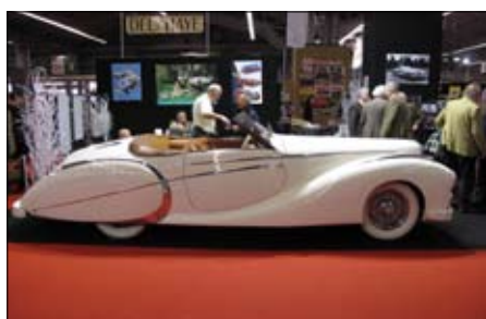
Delahaye 135 na klubovém stánku