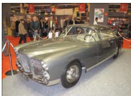
Facel Excellence Coupé