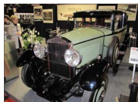
Schneider a Rochet 1930 z lyonské produkce se vrátil do Francie z Alžíru