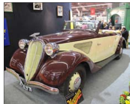
Málo známý Chenard & Walker T 24 C, 1936 2,5 litr, s předním náhonem systeme Gregoire a elektromagnetickou převodovkou Cotal. Byl oblíbený u gangstrů a představoval noblesní konkurenci například Citroënům. Jediný zachovalý exemplář!