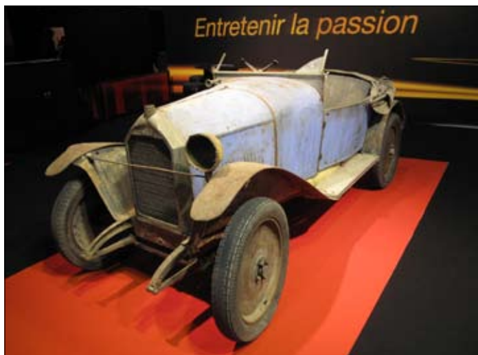
Bugatti typ 28 Torpedo z roku 1922 restaurované pro muzeum Schlumpfů pod patronátem Motulu. Vpravo Mathis P, superlehký vůz, který bude pro muzeum Valancaye restaurován toutéž firmou