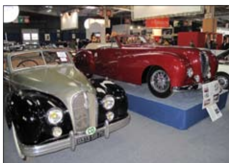
Panhard, Delahaye a Bentley jsou též v nabídce Aukce Artcurial