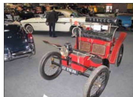
Nejstarší vůz aukce: Decauville 1898