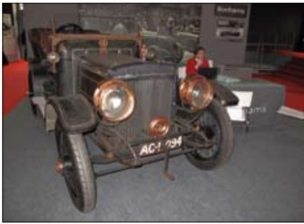
Aukční síp Bonhams nabízí Daimlera 1907, který jen dvakrát změnil majitele