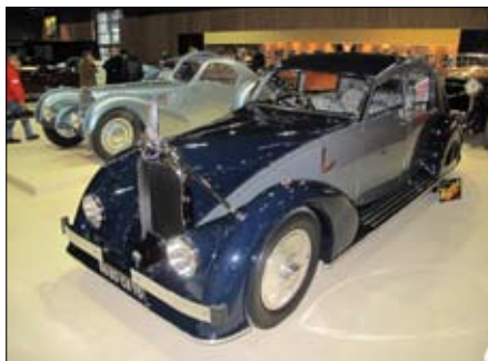
Voisin Aerodyne C25, 1934 ve stylu art déco, v pozadí Atlantic