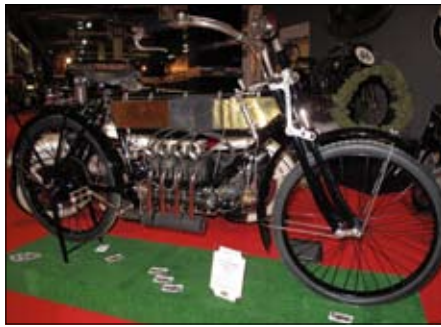
Čtyřválcová Belgica 1910, 1/2 L, konstruktéra Kelemona