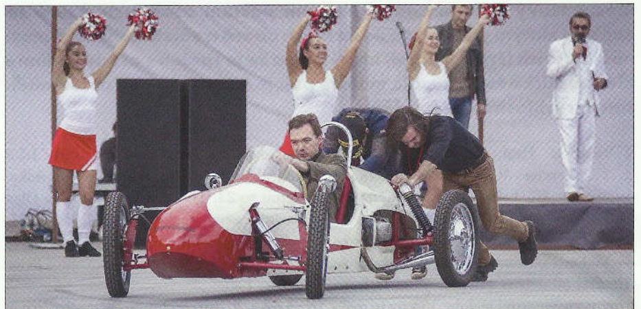
Roztomilý závodáček (BMW) sklízel sympatie návštěvníků – bez děvčec to v Moskvě nejde...