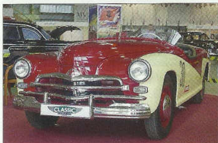
Poběda Roadster – kreace posledních dnů