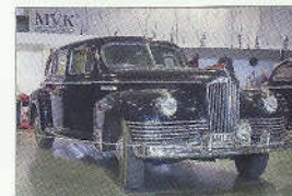
Rus, nebo Američan? Skoro 1 : 1