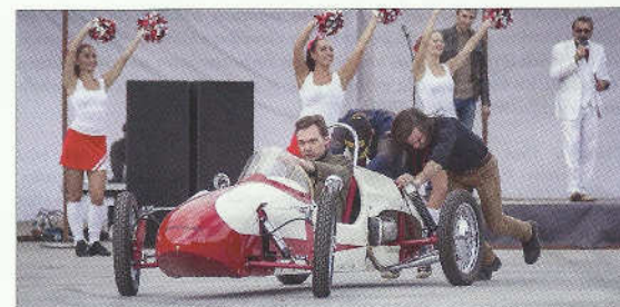
Roztomilý závoďáček (BMW) sklzel sympatie návštěvníků – bez děvaček to v Moskvě nejde...