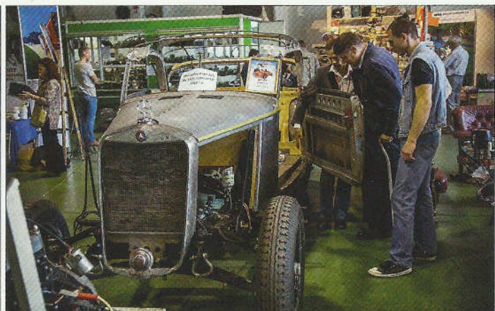
Renovace mercedesů kabrioletů je lukrativní i když je základem nekompletní ruina