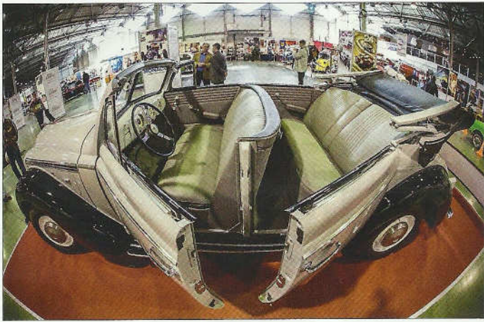
Opel Admiral, kabriolet, svědek zašlé říše