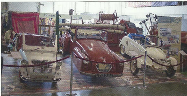
Vlastní show měly mikro káry