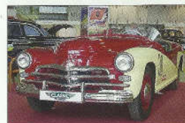
Paběda Roadster – kreace posledních dní