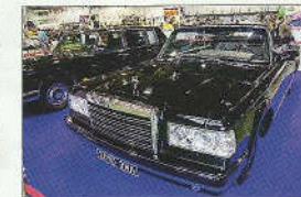
Mohutný ZIL kabriolet