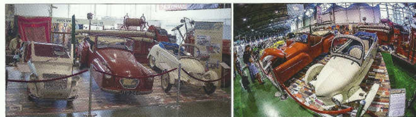
Vlastní show měly mikro káry