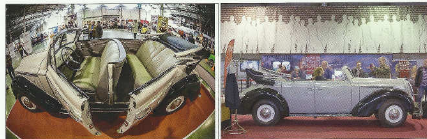
Opel Admiral, kabriolet, svědek zaslé říše