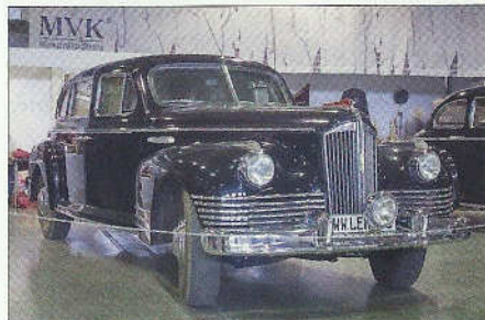
Rus, nebo Američan? Skoro 1 : 1