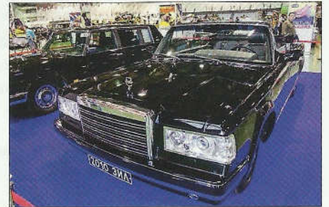
Mohutný ZIL kabriolet