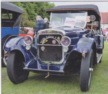
1922 Wills Sainte Claire... str. 54