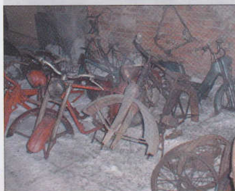
Naše cesta na veteránskou burzu... str. 22