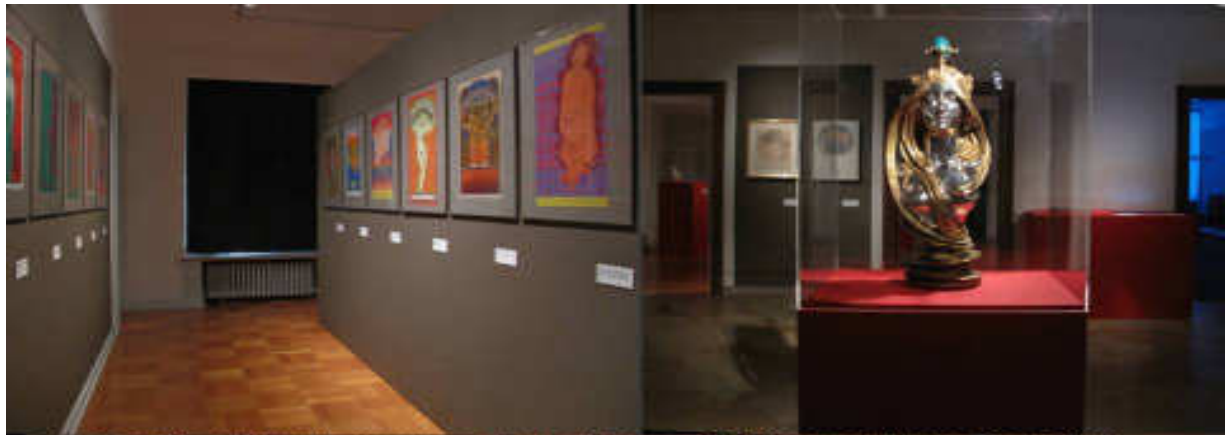
v členitém interiéru muzea Bellerive vynikají exponáty na jedničku