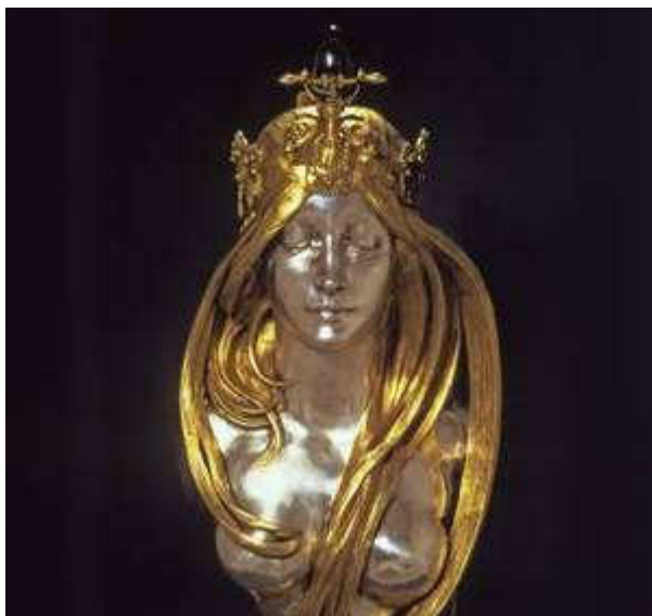
Busta, A. Mucha