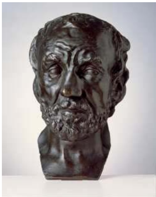
Muž se zlomeným nosem

Rodinovo ležerní pojetí prezentace jeho pozdní tvorby stálo téměř konfrontativně oproti tradičnímu pojetí umělecko-historické pozy. Neklidně zvrásněný povrch je i dnes pro oko dráždivou inovací. Zvláště při diferencovaném osvětlení se střídají odlesk a stín nečekaně silně.