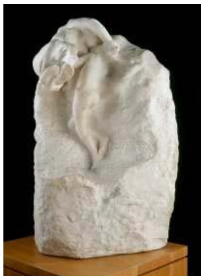
„Země a měsíc“.

Mezi exponáty nechybí slavná díla jako „Polibek“