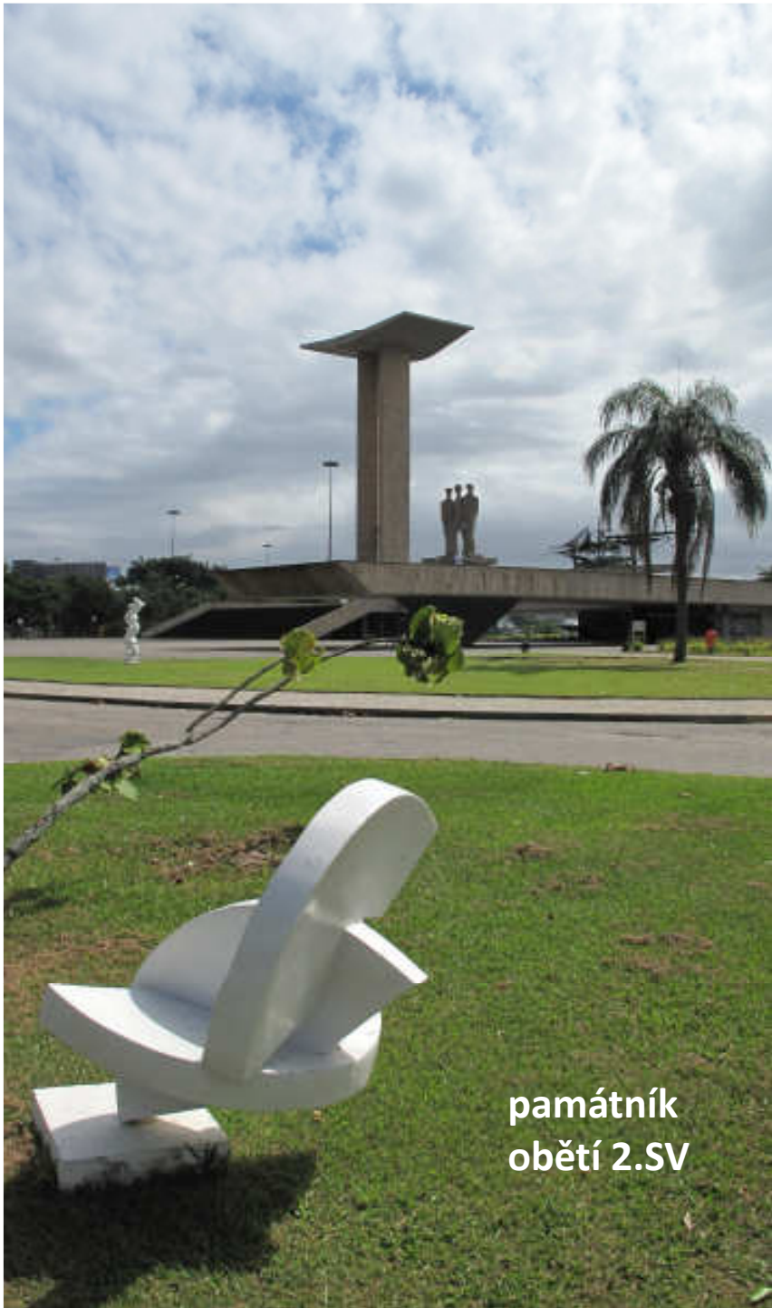
památník obětí 2.SV