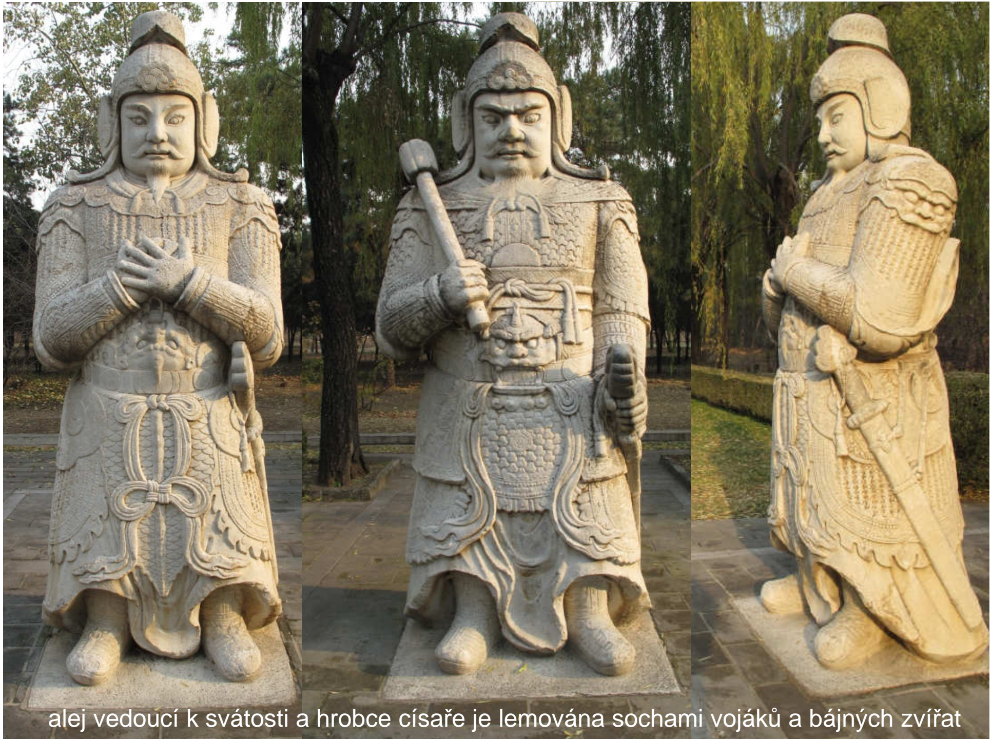
alej vedoucí k svátosti a hrobce císaře je lemována sochami vojáků a bájných zvířat