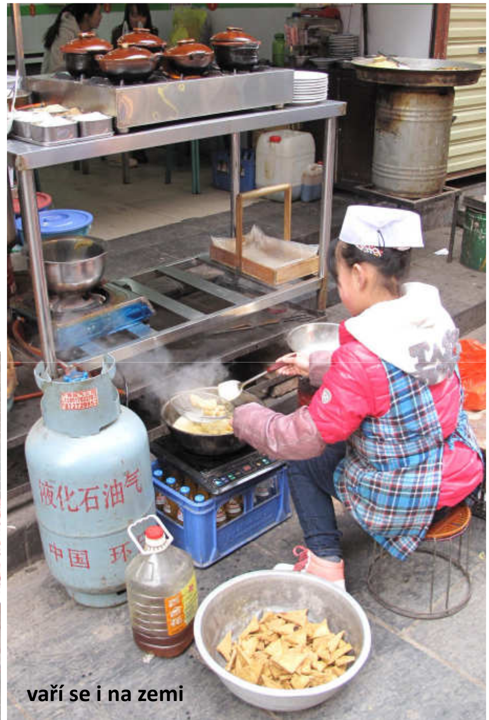
vaří se i na zemi