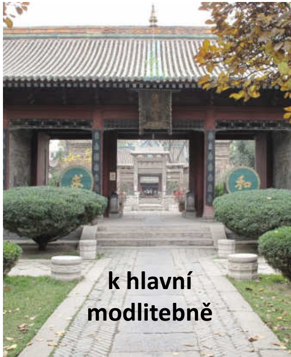
k hlavní modlitebně