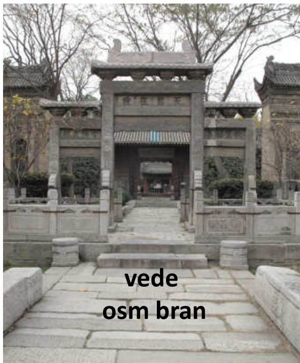
vede osm bran