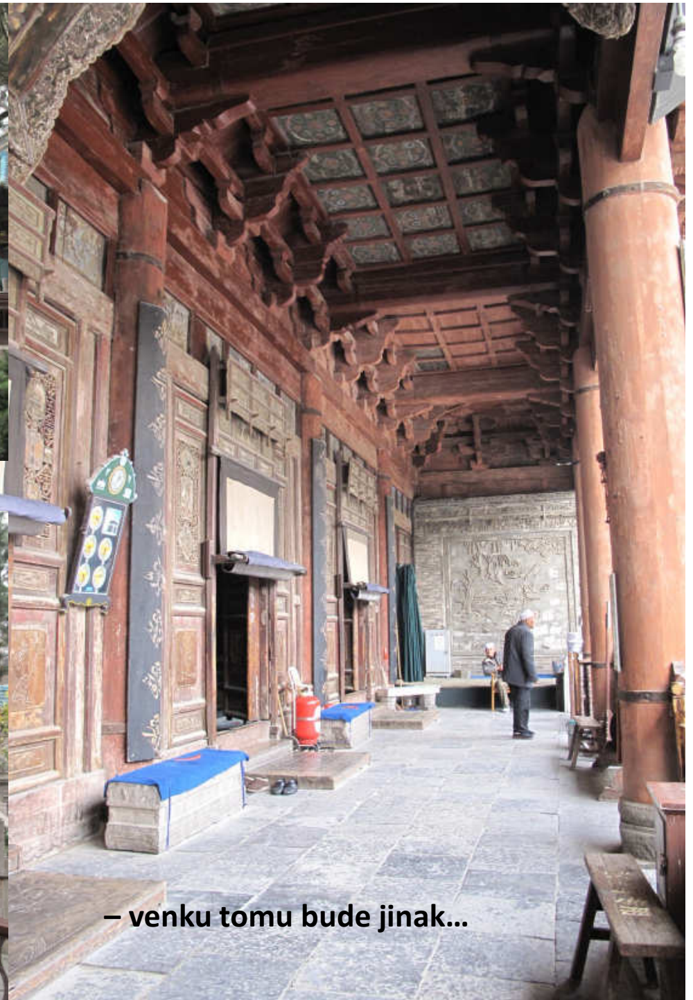
– venku tomu bude jinak...