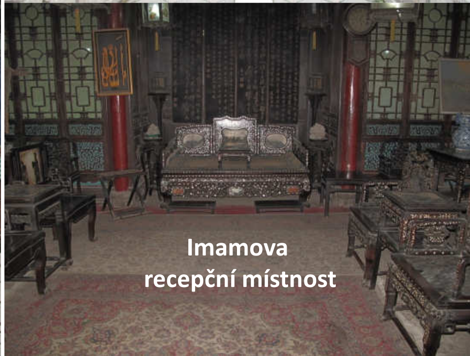
Imamova recepční místnost