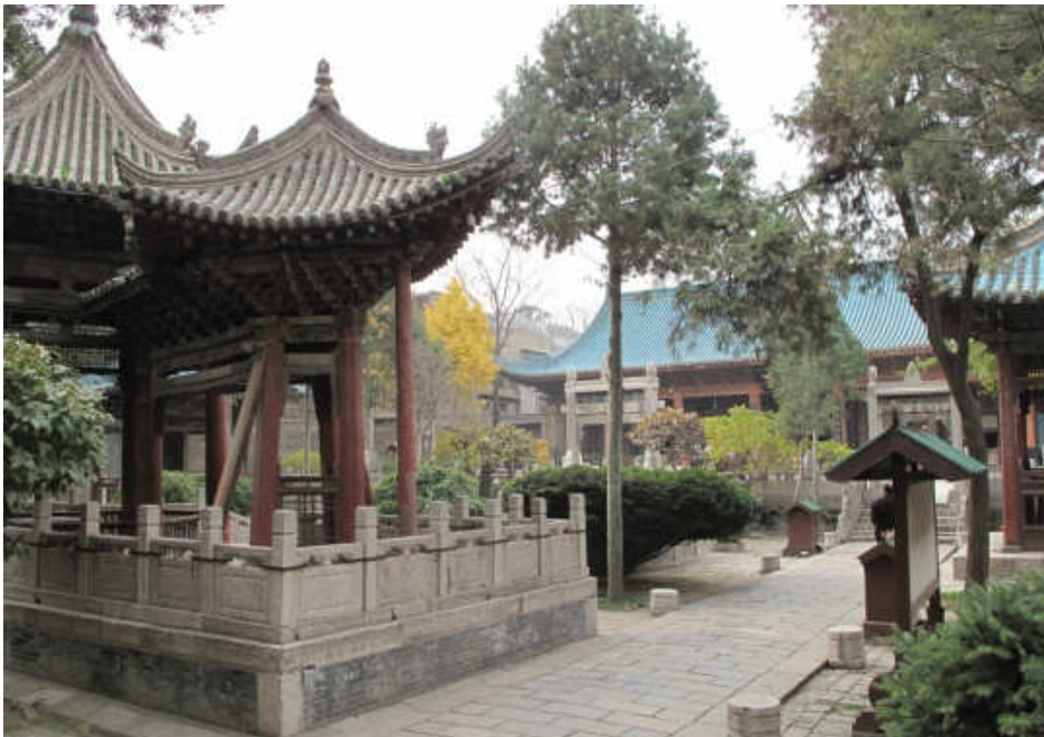
krásná zákoutí a božský klid