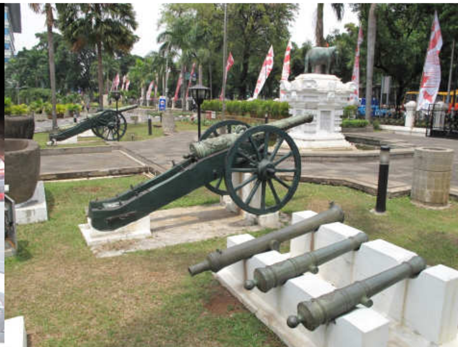
Vojenské a národní muzeum