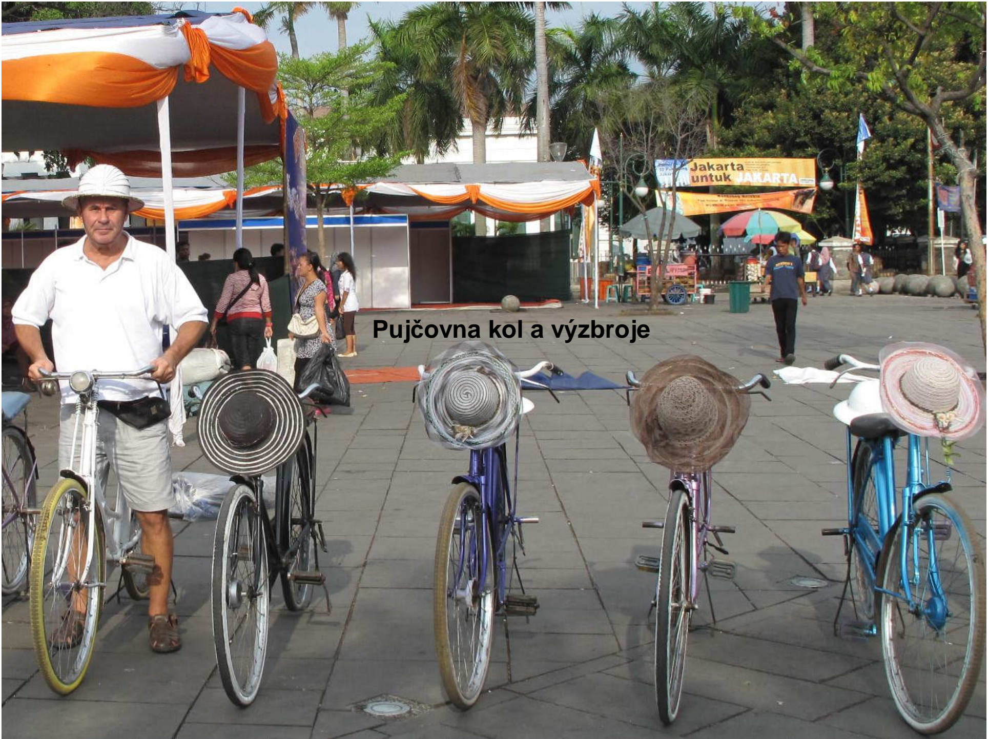
Pujčovna kol a výzbroje