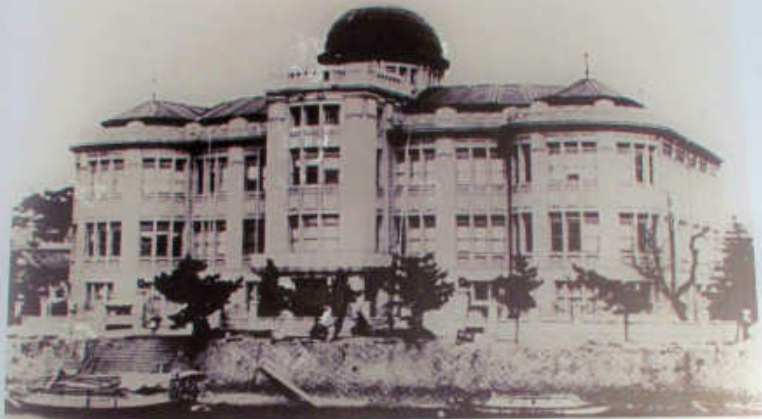
被爆前の広島県物産陳列館 The hall before the bombing