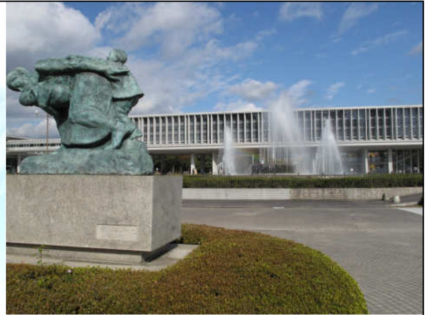
Museum der atomaren Explosion Budhistische Gedenkglocke für die Opfer Rentner im Park...