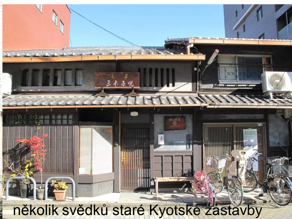
několik svědků staré Kyotské zástavby