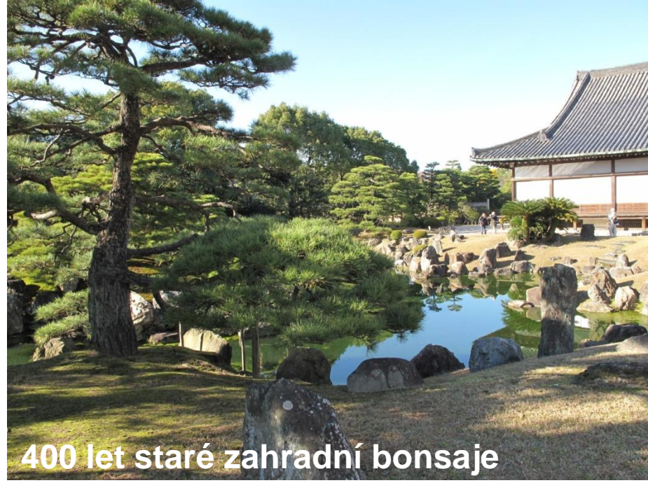
400 let staré zahradní bonsaje