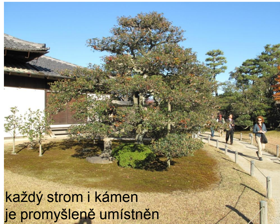
každý strom i kámen je promyšleně umístěn