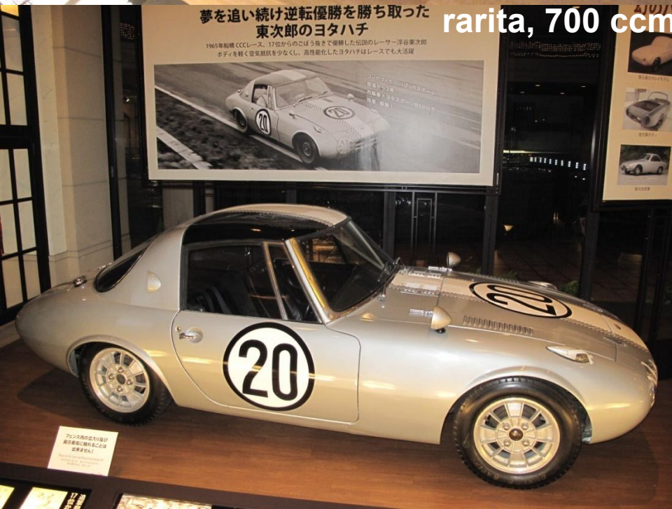
rarity, 700 ccm, posuvna střecha