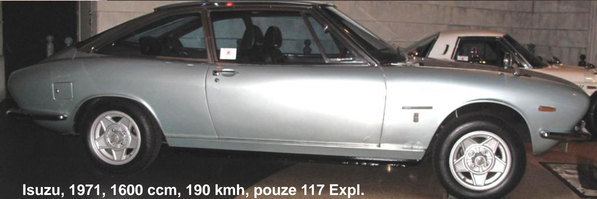
Isuzu, 1971, 1600 ccm, 190 kmh, pouze 117 Expl.