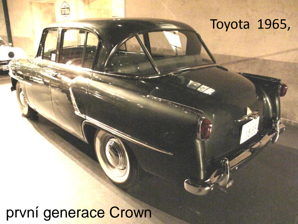
Toyota 1965, 100 kmh, 1500ccm