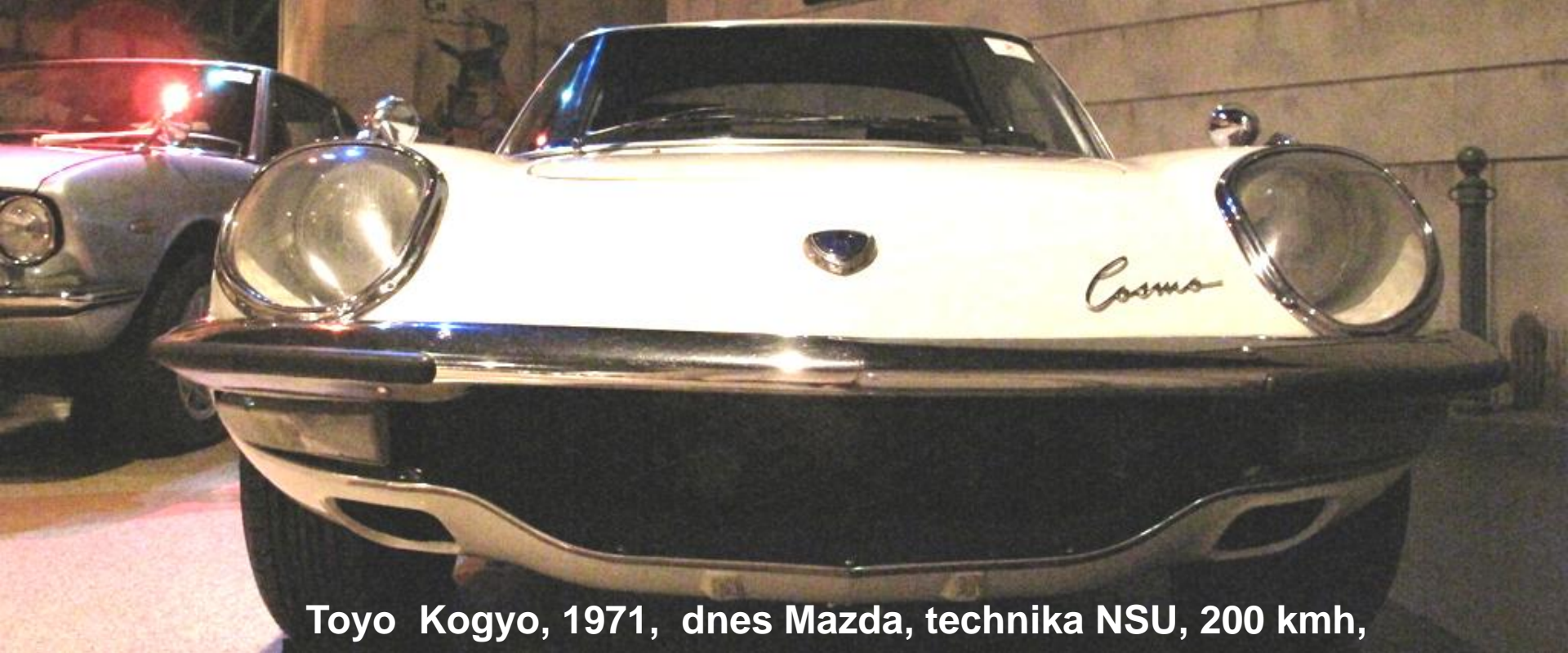
Toyo Kogyo, 1971, dnes Mazda, technika NSU, 200 kmh,