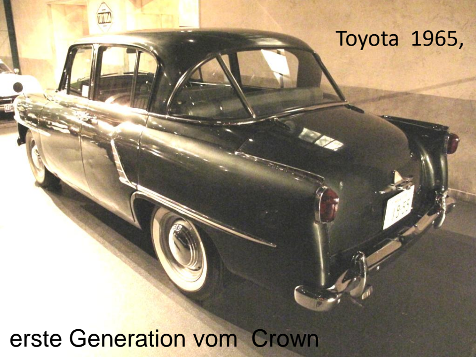
Toyota 1965, 100 kmh, 1500ccm