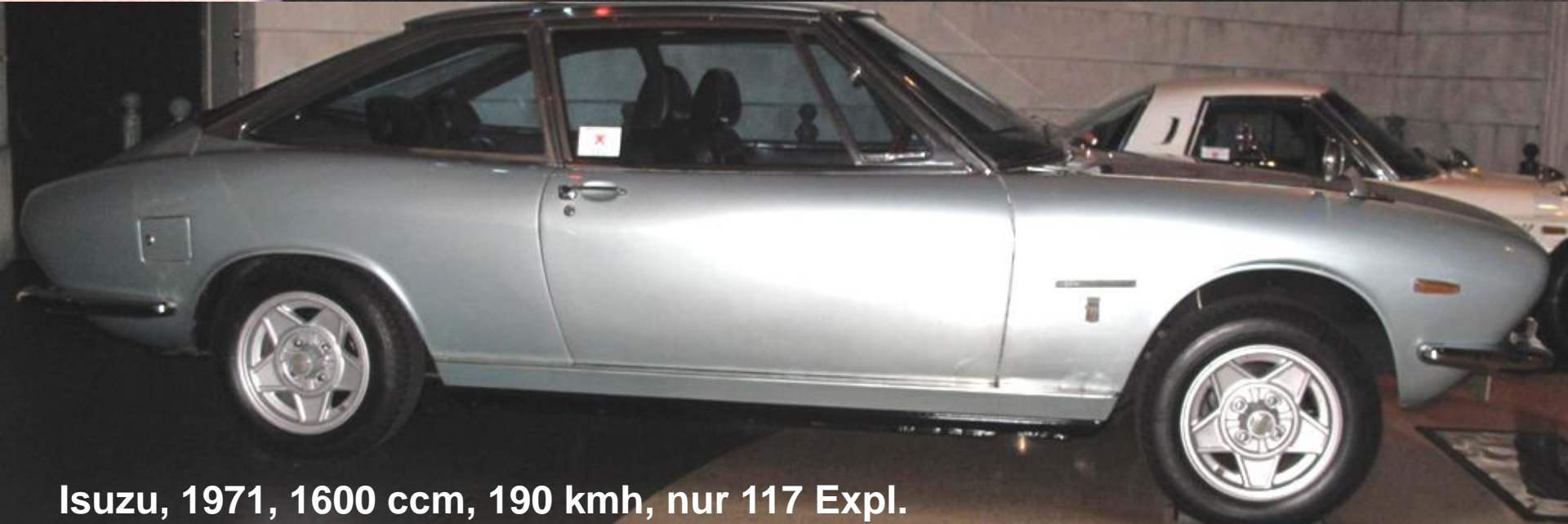
Isuzu, 1971, 1600 ccm, 190 kmh, nur 117 Expl.