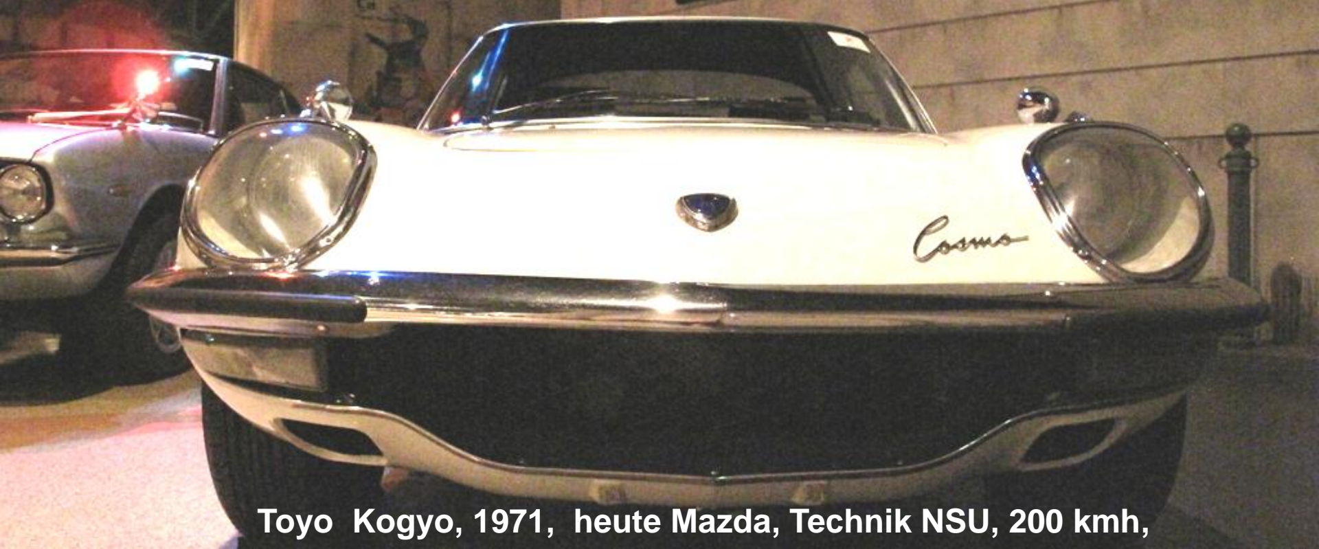
Toyo Kogyo, 1971, heute Mazda, Technik NSU, 200 kmh,