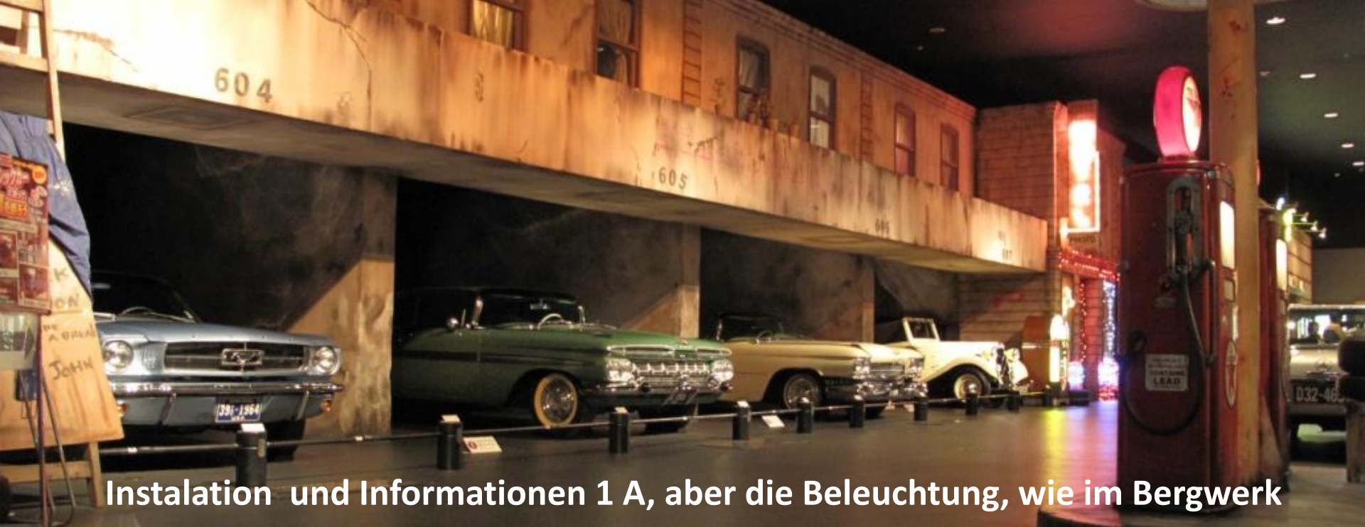
Instalation und Informationen 1 A, aber die Beleuchtung, wie im Bergwerk