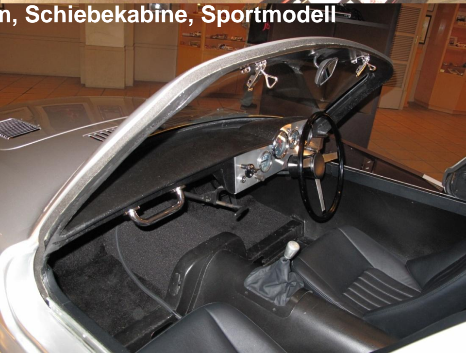
Rarität, 700 ccm, Schiebekabine, Sportmodell