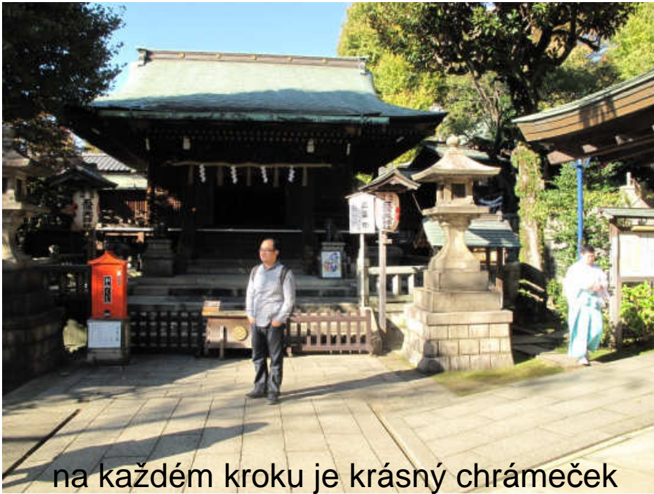
na každém kroku je krásný chrámeček