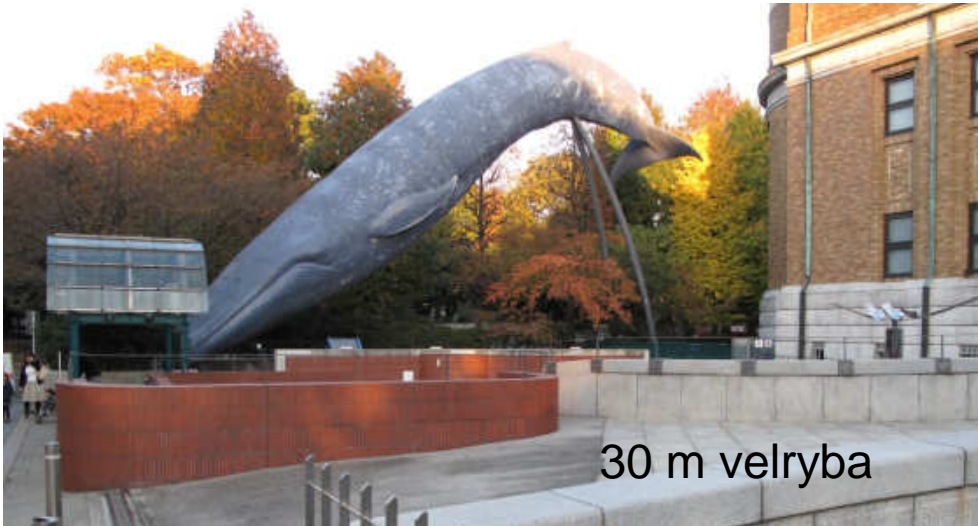
30 m velryba