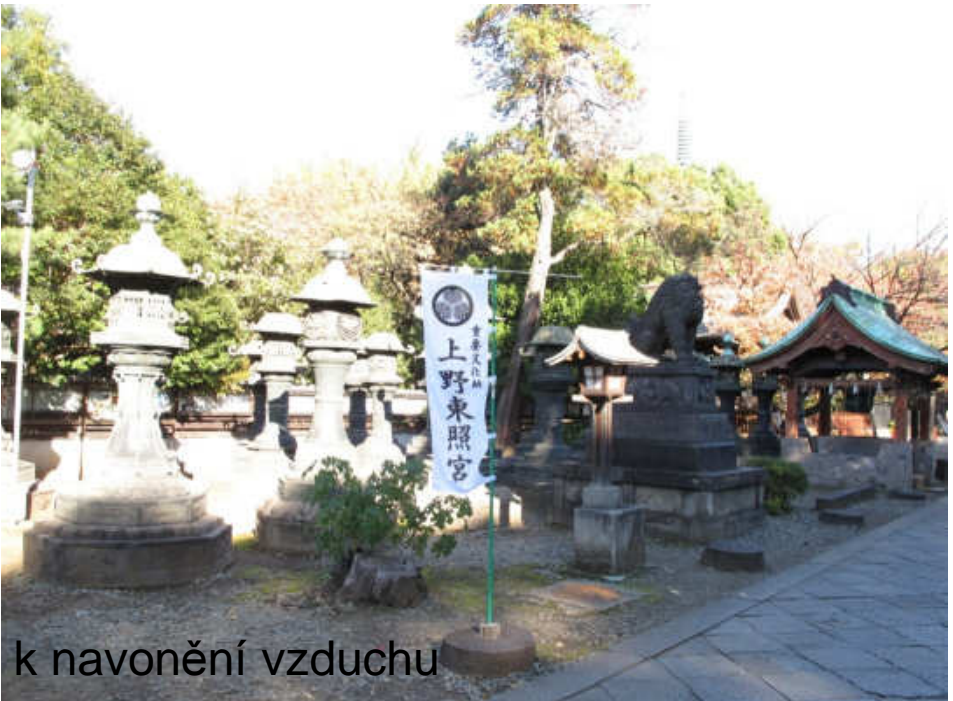
desítky měděných lateren se používalo k navonění vzduchu