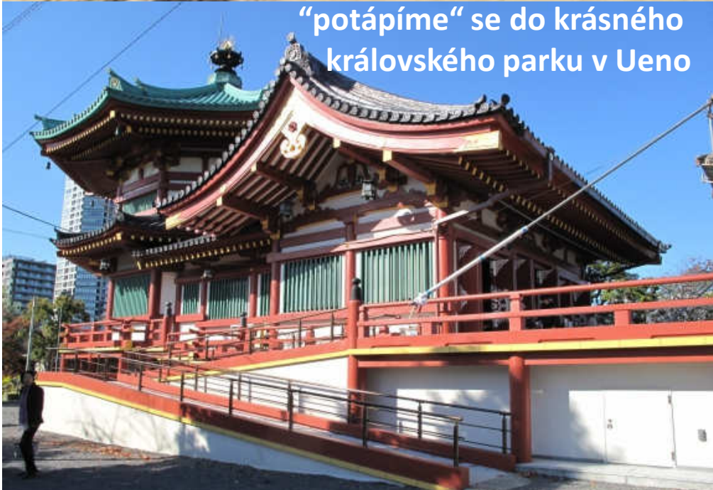
“potápíme” se do krásného královského parku v Ueno