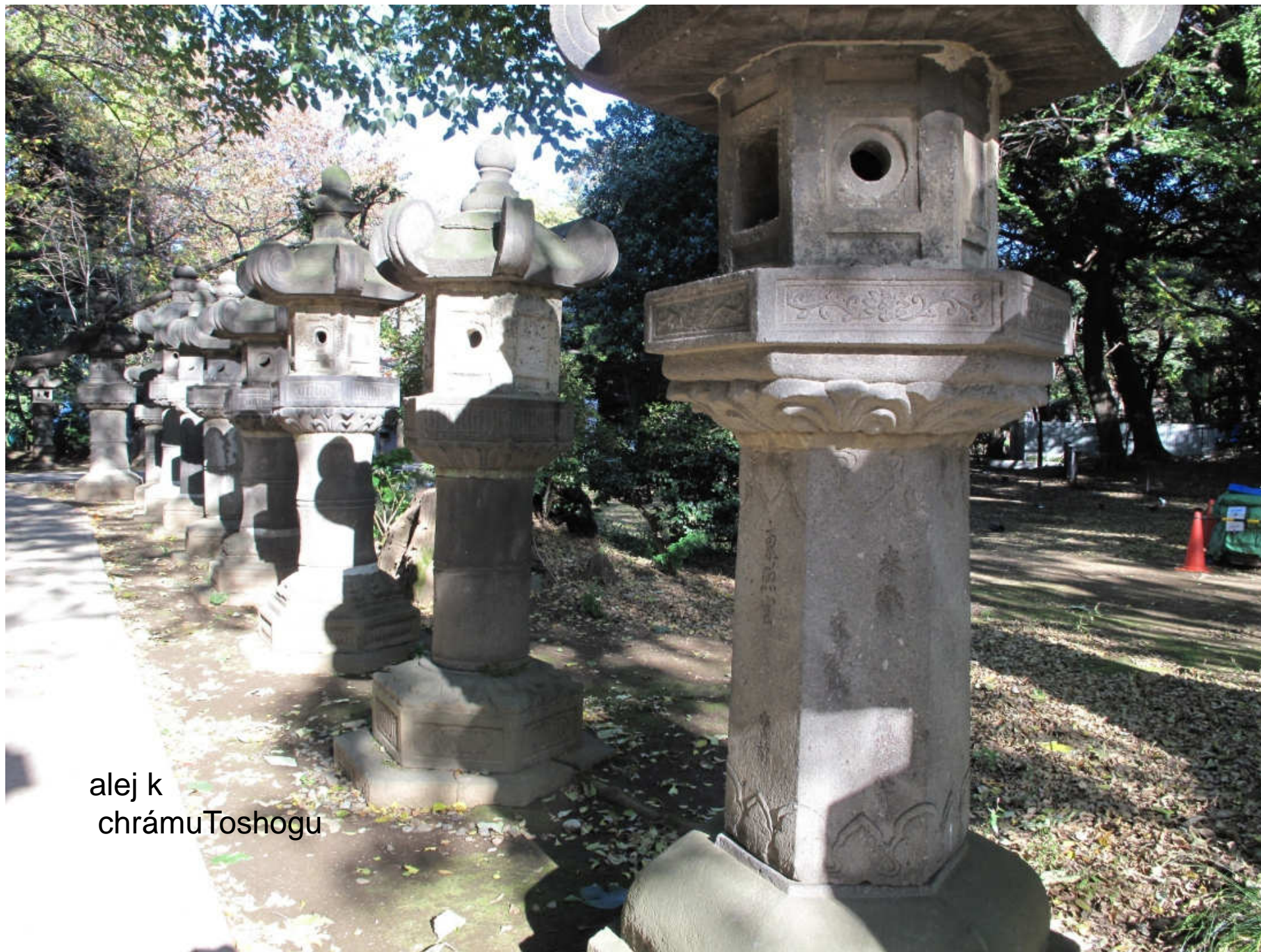
alej k chrámu Toshogu