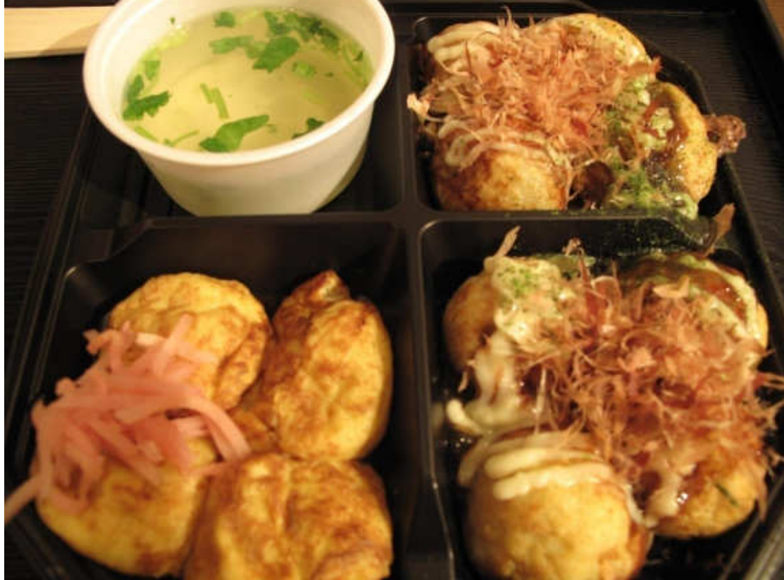
dnes zajímavé těstové kuličky s různou náplní