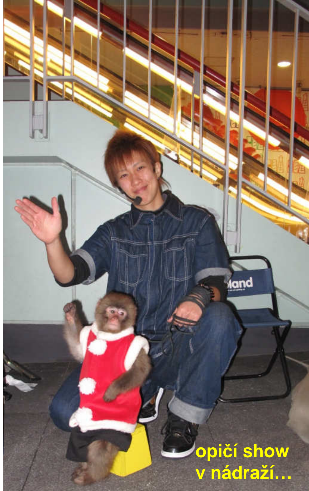
opičí show v nádrazí...