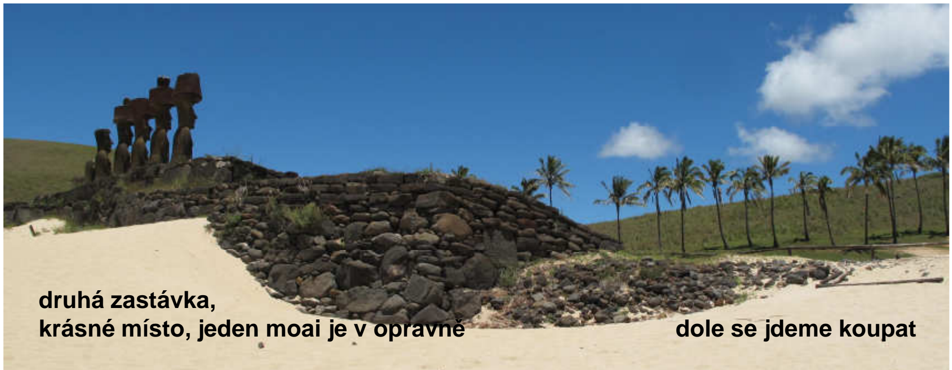
druhá zastávka, krásné místo, jeden moai je v opravně