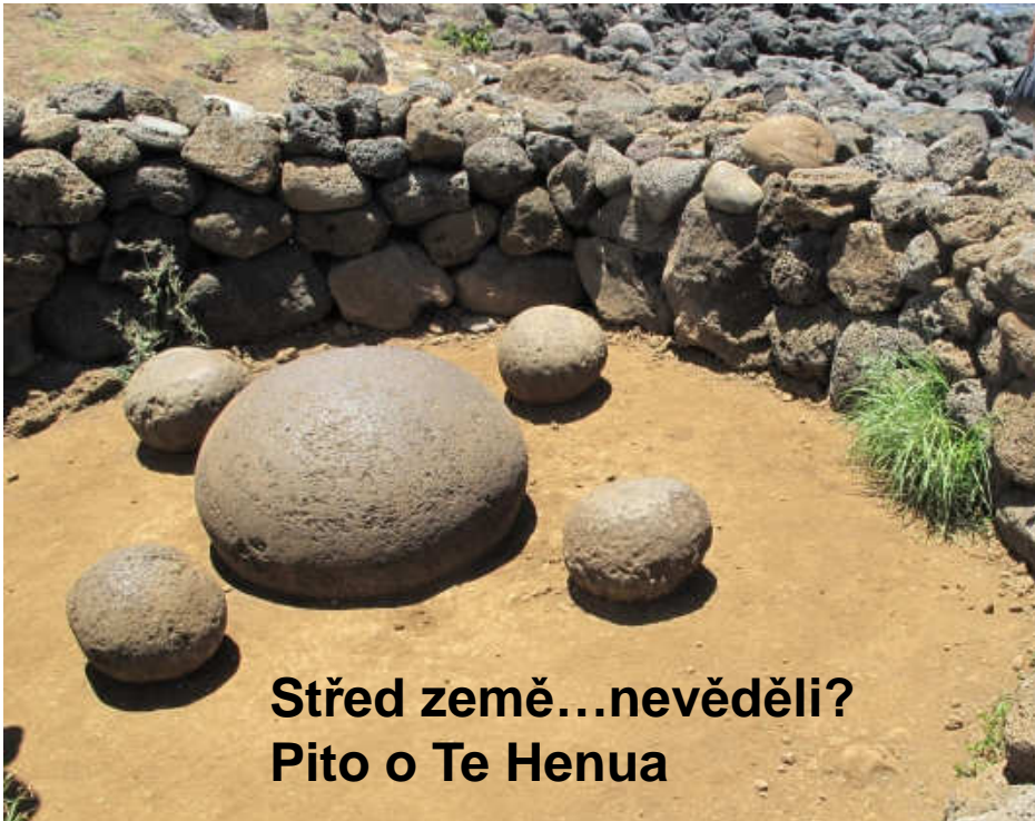
Střed země...nevěděli? Pito o Te Henua