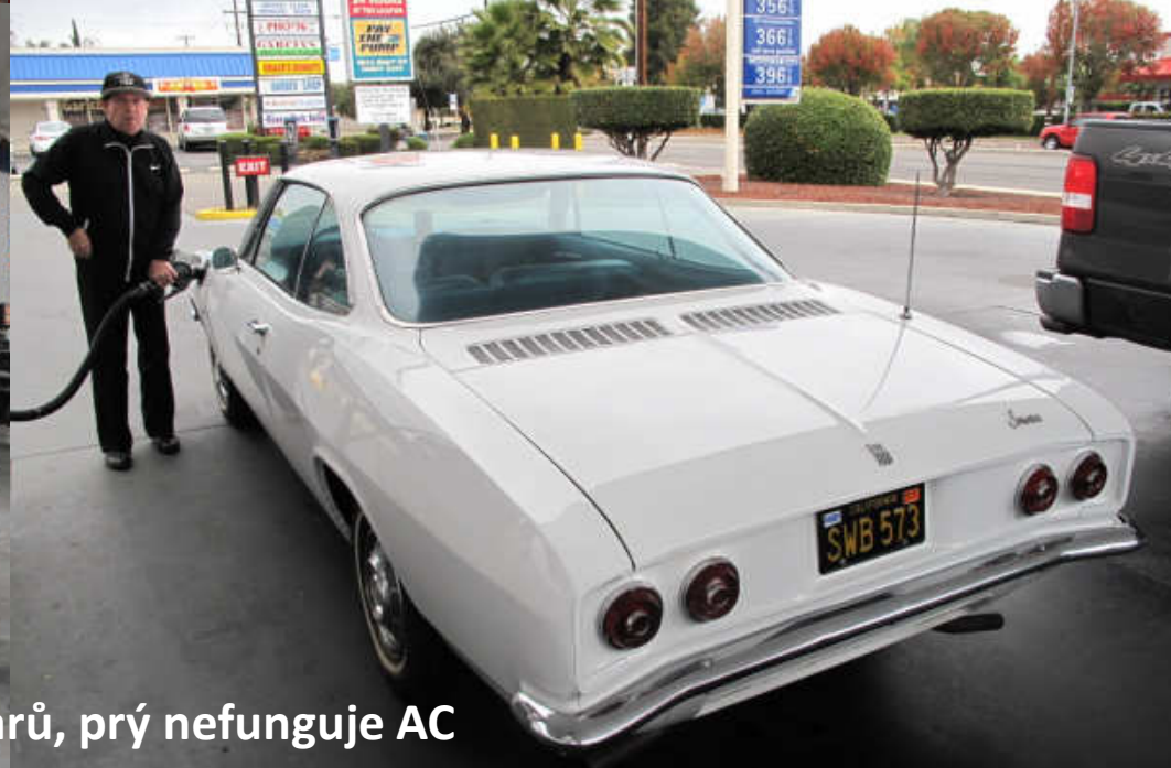
majitel mě to auto chtěl prodat za 30 dolarů, prý nefunguje AC