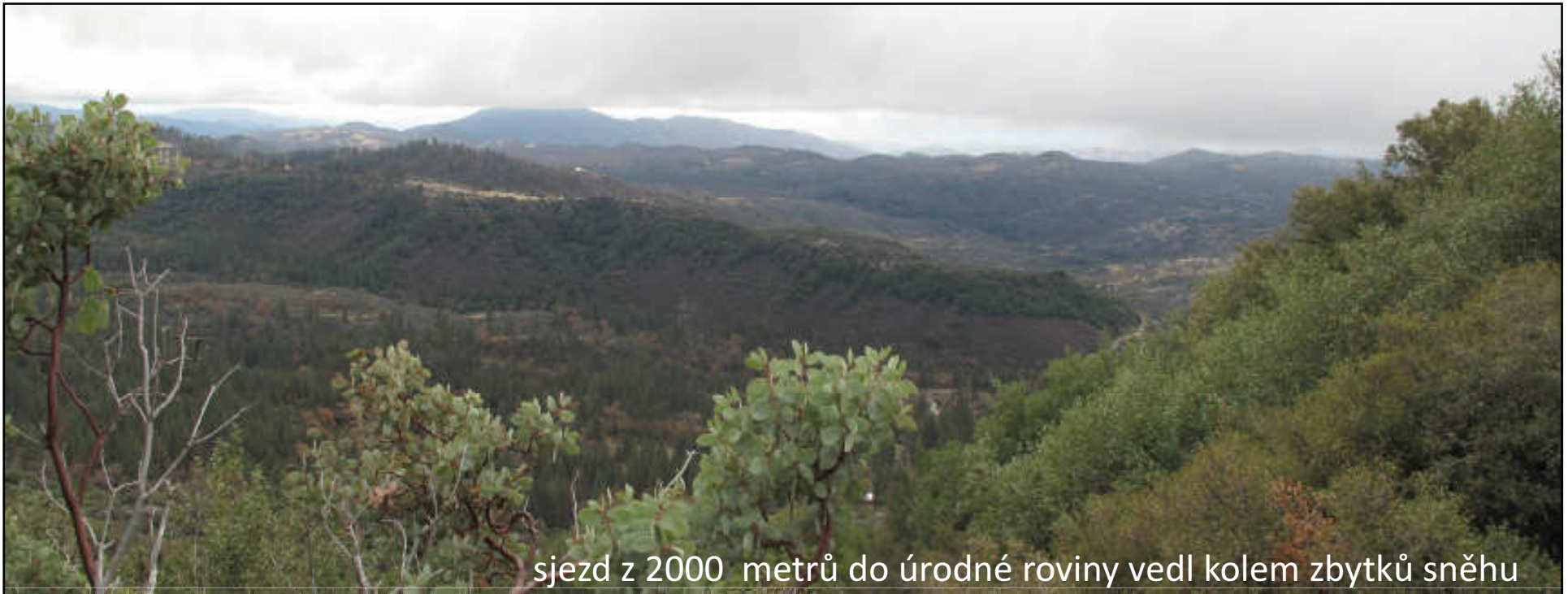
sjezd z 2000 metrů do úrodné roviny vedl kolem zbytků sněhu