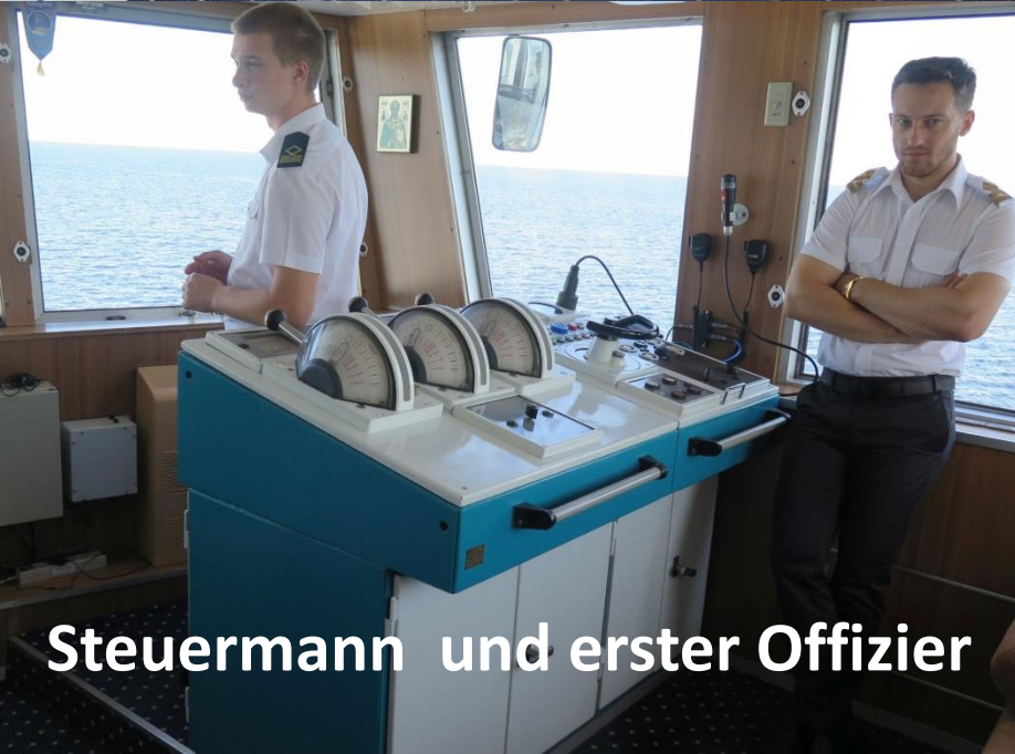
Steuermann und erster Offizier