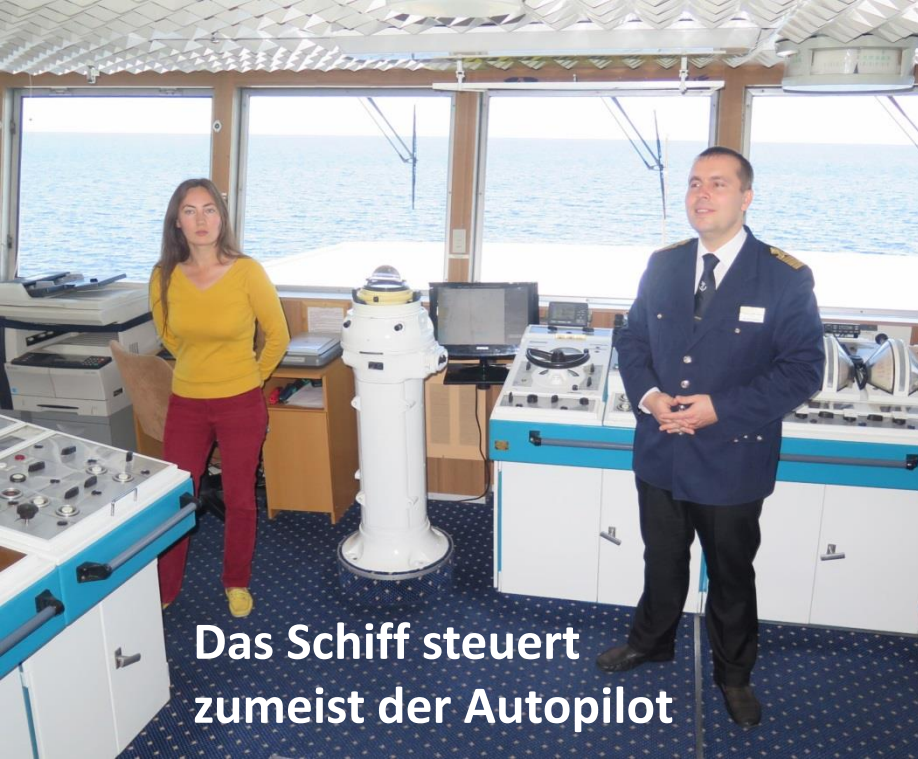
Das Schiff steuert zumeist der Autopilot