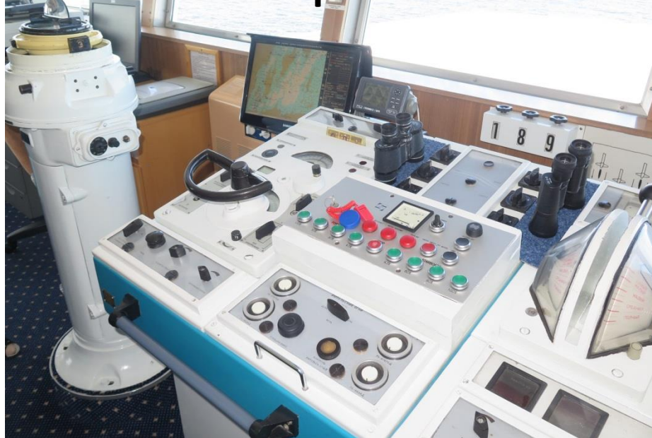
während der Kapitän der Anita erklärt, wie das Radar funktioniert