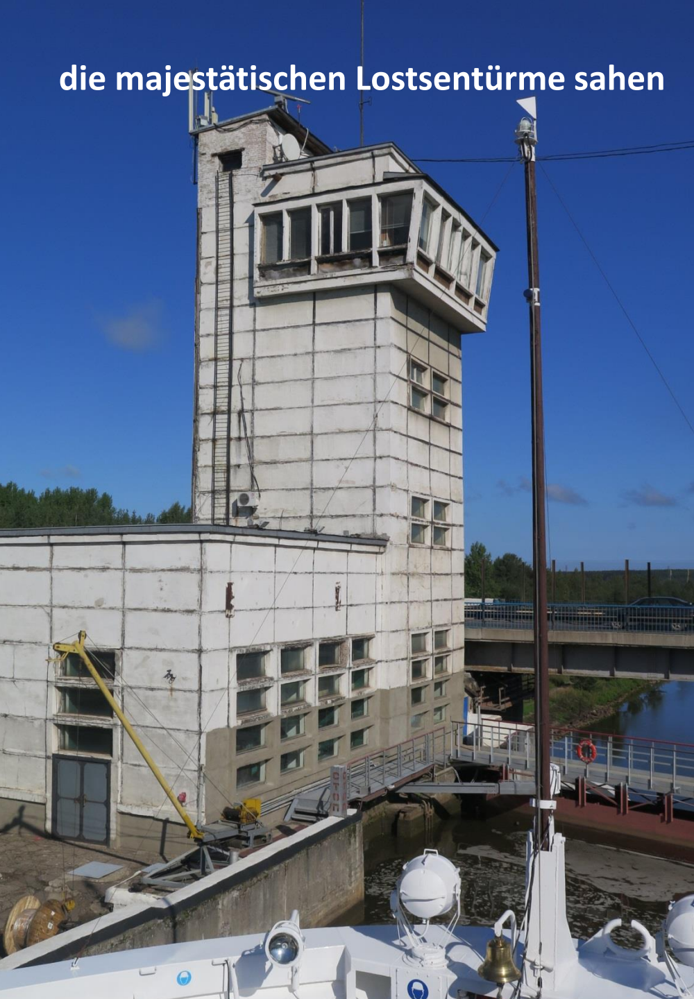
die majestätischen Lostsentürme sahen