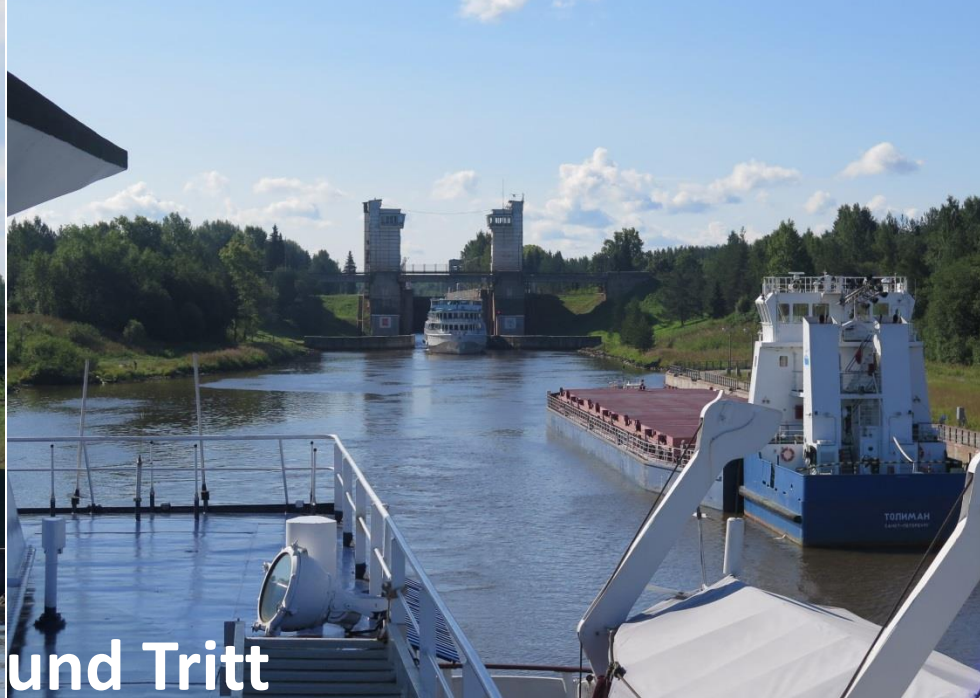
«Lenin» folgt uns auf Schritt und Tritt