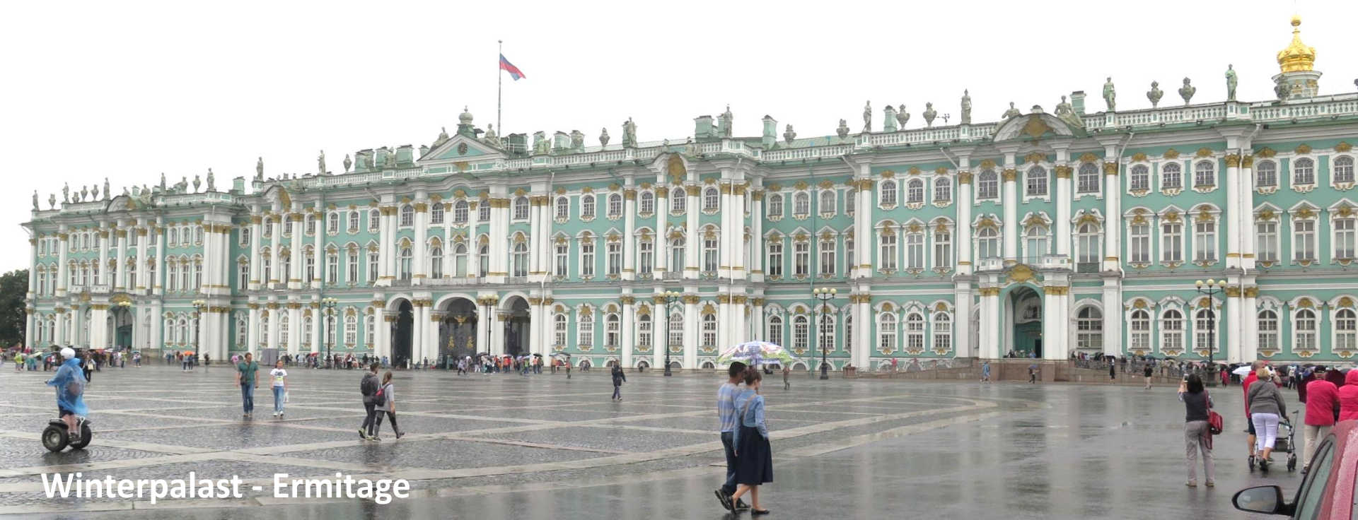
Winterpalast - Ermitage