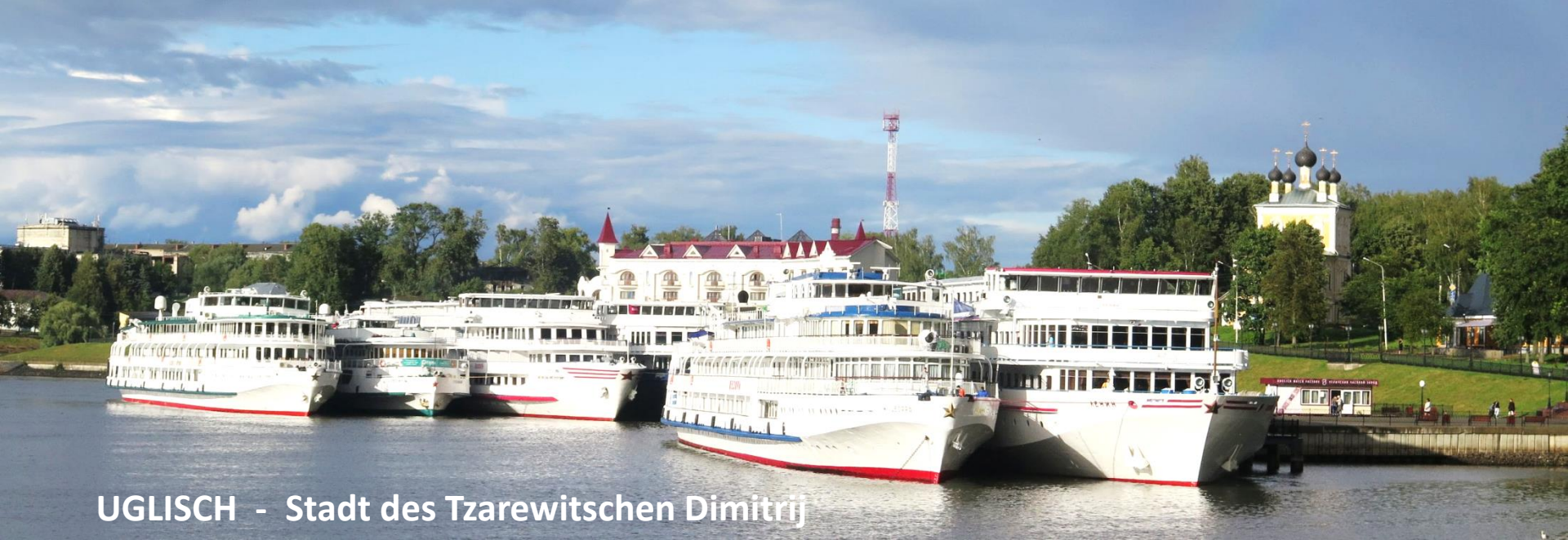
UGLISCH - Stadt des Tzarewitschen Dimitrij