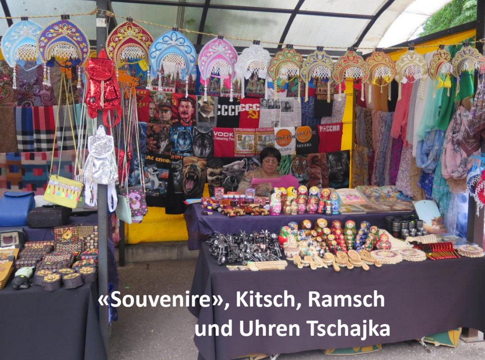
«Souvenire», Kitsch, Ramsch und Uhren Tschajka