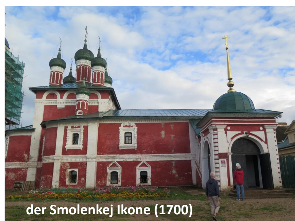
der Smolenkej Ikone (1700)