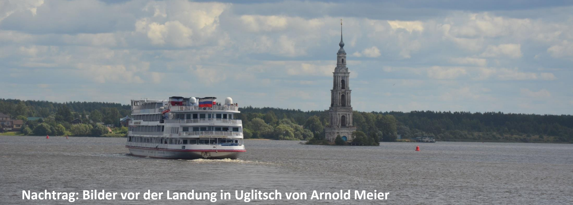
Nachtrag: Bilder vor der Landung in Uglitsch