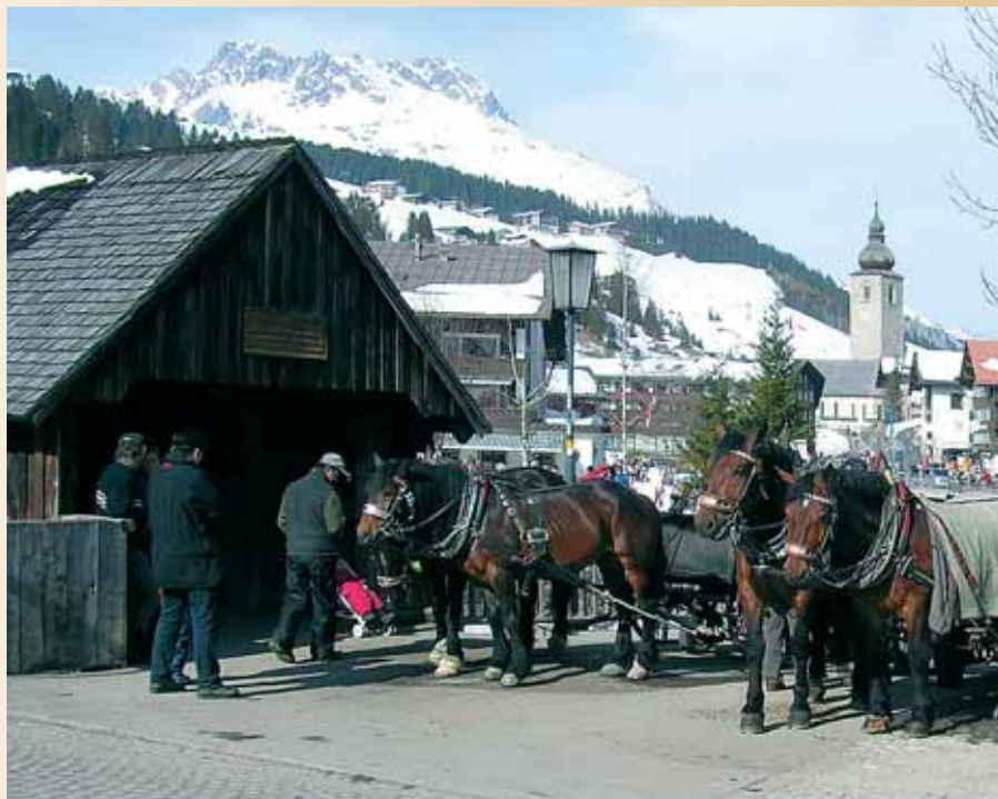
Koně patří neodmyslitelně i k dnešnímu Lechu

HURÁ NA LYŽE více jak 53 středisek • KATALOG zašleme ZDARMA Jindřišská 30, Praha 1, T/F: 224 23 60 28, Eurotel: 724 044 055