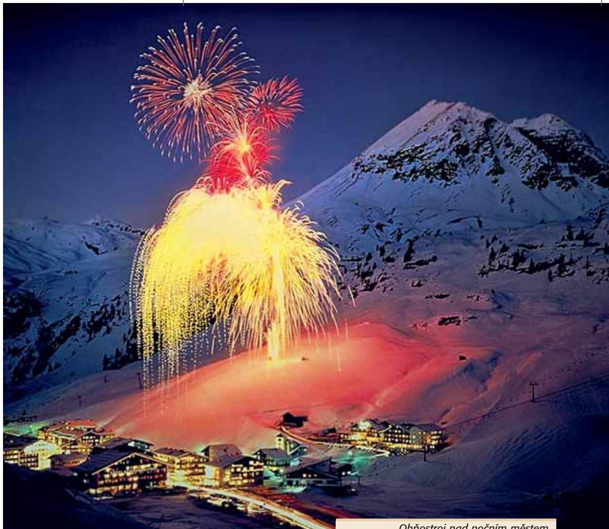
Ohňostroj nad nočním městem

O dámy a pány s vysokým očekáváním a plnou peněženkou je v Lechu postaráno stejně jako v St. Moritz. Nechybí snad žádný světoznámý butik. Nechybí však ani dostatek možností zásobit se v supermarketech. Naprostou «povinností» je návštěva miniaturní sýrárny a uzenářství u dřevěného mostu na hlavní ulici. Vstřícný a upovídaný majitel vám nejdříve dá ochutnat od všeho, co sám vyrábí, zapíjet se dá domácím obsterem (pálenka z ovoce). Kdo nic nekoupí, byt jen maličkost, tak se sám osídí.