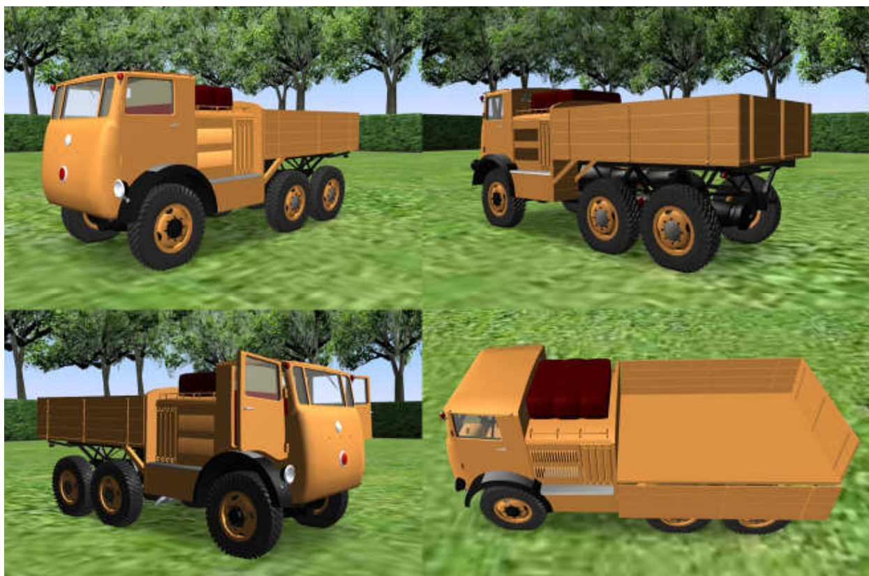
Snímky z počítačové rekonstrukce Tatry 84

Průchodivost terénem však musela být fenomenální – nájezdové úhly cca 75 stupňů vpředu i vzadu, těžiště téměř ideálně uprostřed vozu (!), plně pohonný podvozek, krátký rozvor mezi první a prostřední nápravou. Dokonce byla prý vybavena i uzávěrkou předního diferenciálu. Na kvalitních terénních pneu musela dělat zázraky. Zřejmě jediným potenciálním problémem mohl být výkon motoru, který je z dnešního hlediska dost malý.