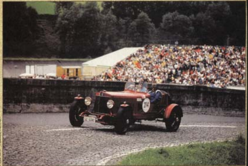
Foto OK - Klausenmenen