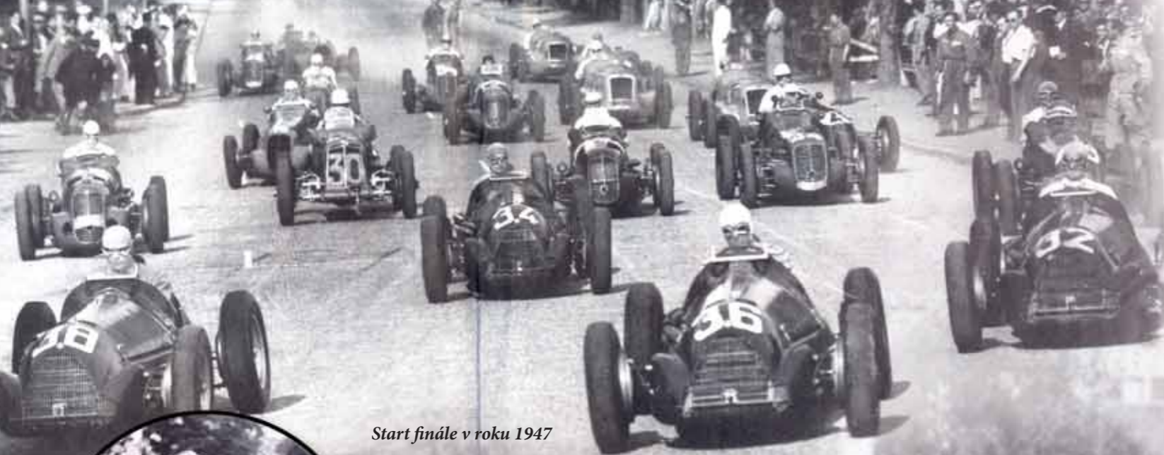
Start finále v roku 1947