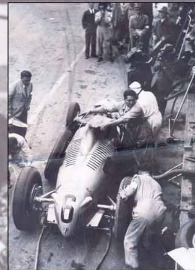
Rudolf Caracciola si v roku 1937 jede pro vítězství