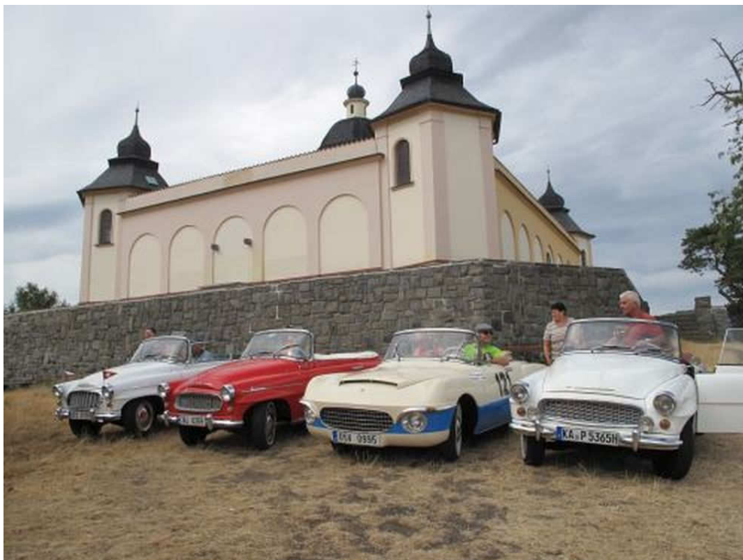
Ze sušického náměstí

jsme se vydali „spanilou“ jízdou nad město ke kapli sv. Anděla Strážce (“Andělíčka“..) Odtud je krásný pohled téměř na celé město. Cesta pak vedla do nedalekých Albrechtic s odparkováním aut, pokračovala osvěžením v zahradní restauraci před pěší túrou na výšinu o 902m/n.m. k impozantní dřevěné rozhledně Sedlo měřící 27,75m. Odtud se skýtá nádherný výhled na velkou část Šumavy.